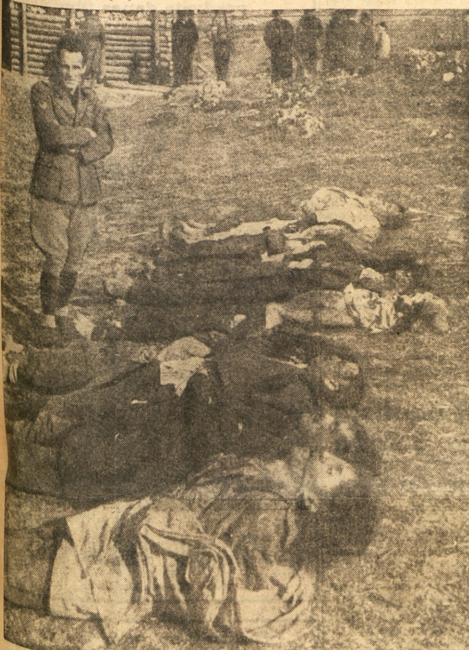
Fašist se je slikal pred žrtvami njihovega nasilja blizu Radohove vasi. Tudi znak njihove ukulture in civilizacije.