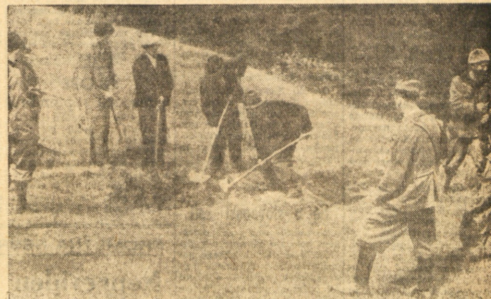
Italijanski okupator je prisilil žrtve, da so si morale same izkopati grob.

Vaši računi niso čisti, in z nečistimi računi se ne boste mogli zagovarjati pred svetovnim javnim mnenjem, pred izmučenim obličjem našega toliko preizkušenega primorskega