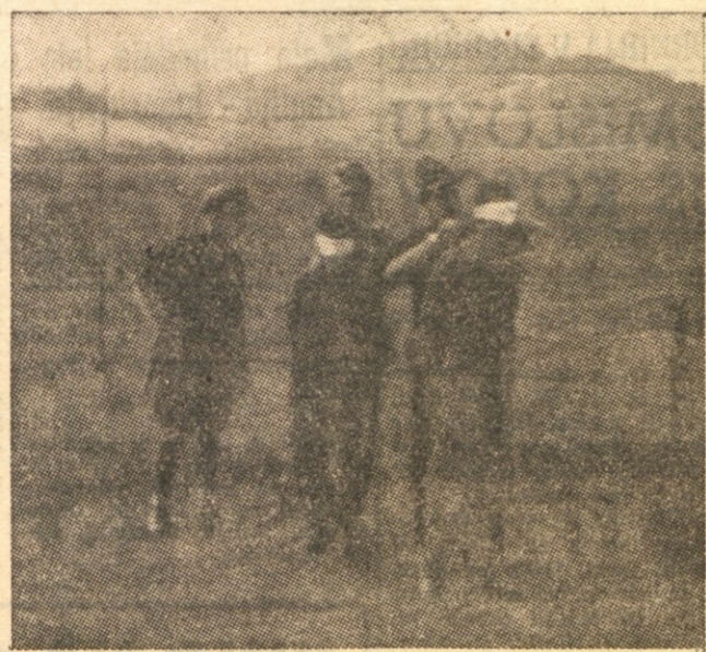
Ujete partizane so zločinci mučili, pred puške pa so jih postavili z zavezanimi očmi.

Tako: zgodilo se je: predstavnik vlad Velike Britanije in Združenih ameriških držav sta sporočila prizadetima državama svetovni javnosti, da obe vladi odločili izročiti Italiji upravo cone Tržaškega ozemlja in vrniti svoje čete, ki naj jih nadomestila italijanska vojska. Na to dejanje samovoljno, v kričnem nasprotju s črko in duhom mirovne pogodbe, v opreki z določbo, ki prepoveduje Italiji držanje njenih čet v dvajsetkilometerskem pasu tu di vzdolž jugoslovanske meje, na to dejanje samovoljno in nasilja, ki je krati sovražno dejanje