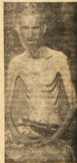
«Bolni človek — človek, ki da mira v koncentracijskem taborišču na Rabu.