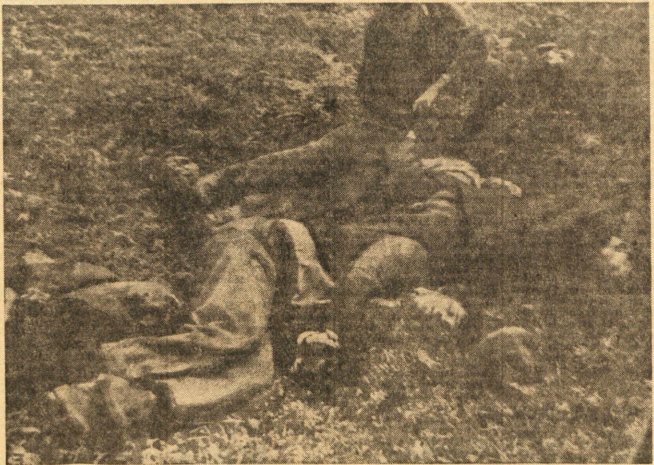
Roparji: fašist snema mrtvi žrtvi prstan z roke

ša volja odmeva po vseh jugoslovanskih trgih in ulicah, naša volja polje po žilah vsega jugoslovanskega ljudstva, ljudstva, ki se ne bo nikoli sprijaznilo z barantanjem na njegov, na naš račun, in ki ne bo nikoli dopustilo, da bi italijanska okupatorska vojska še kdaj stopila na ta naša tla, od koder jo je naše ljudstvo spodilo razoroženo.