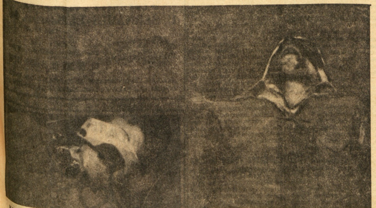
Kdaj se je upri nasilju fašistov in italijanske redne vojske je končal v taboriščih, ječah, na streliščih. Mnogi so se za gore, da pribore svoji zemlji svobodo. Gorje tistemu, ki so ga italijanski okupatorji dobili živega v roke.