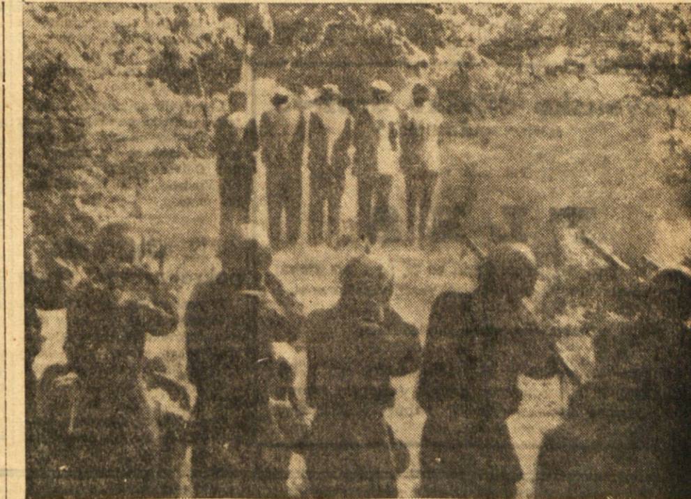
Gornja slika, ki so jo naši v žepu ujetega italijanskega vojaka med okupacijo Jugoslavije, pričča o ustavnih dejanjih Italijanske vojske v drugi svetovni vojni.