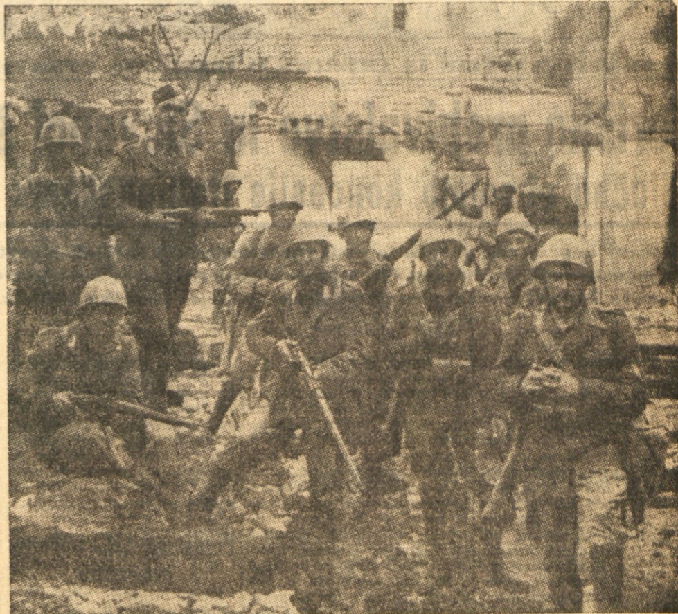
Takšno je bilo početje slavne italijanske vojske na slovenskih tleh.

Vi, učitelji pragmatizma in «morales» uspeha, vedite, da pozna naš narod globljo moralo, ki se je krepila v hudih in krvavih borbah za naš obstoj in jeklenela v zadnji osvobodilni vojni, ko je šlo za naš biti ali ne