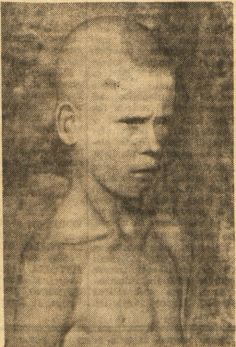
V strahotnem taborišču na Rabu so trpeli tudi otroci.