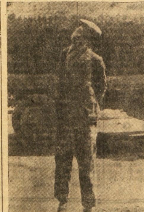
Na tisoče zavednih ljudi je umiralo mučeniške smrti pod okupatorjevo roko,