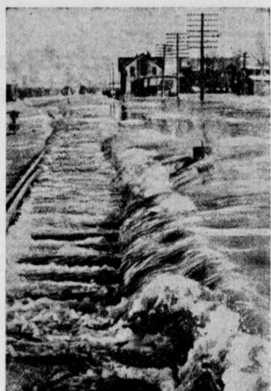
Povodenj v Ameriki. Pri mestu Cairo dere voda čez železniški nasip v nižje ležeče dele

Ko so prišli bliže, so zagledali tujo ladjo, katero so valovi metali semtertja in si ni mogla nič pomagati, ker krmilo ni več delovalo. Ladjo so valovi nosili kar počez. Ladja se je imenovala »Esperac«. Parnik »Estec« je prihajal bliže ter signaliziral nesrečnim mornarjem, da bo pomagal. Z raketami so mornarji odgovorili, da so razumeli in da čakajo. Ker pa je bila še noč, je bilo treba čakati dneva, ker je bila sicer nevarnost, da bi se zgodila še nova nesreča ob razburkanem morju. Šele ob 9. dopoldne so mornarji parnika »Estec« opazili vso nesrečo škotskega parnika »Esperac«. Valovi so odrglali od ladje že poveljniški most, ventilatorje, reševalne čolne ter oddelek za zgornjo svetlobo v strojni in kajutah. Sprednji del ladje je bil kar razbit. Tež nesrečni ladiji se je torej parnik »Estec« približal, kolikor se je pač mogel in smel. Na reševalnem obroču so vrgli reševalci na drugo ladjo jekleno vrvo, s katero so potem škotski mornarji svojo ladjo privezali za rešujoči parnik. Ker pa je viharno morje obe ladji preveč premetavalo, se je vrvo prerulgalo. Ko so