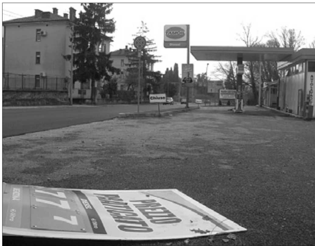
Zaprti črpalki v Ulici Lungo Isonzo Argentina in v Tržaški ulici