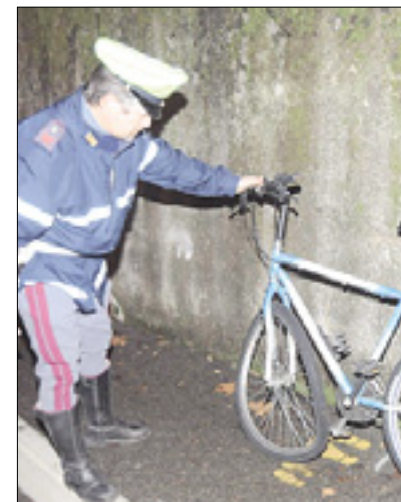
Kolo ponesrečenca na Pilošču BUMBACA

Garzarolli je rešilna služba 118 intervenirala na Pilošču v Štandrežu, kjer se je huje ponesrečil kolesar. 48-letnega domačina E.L., ki so ga zaradi pretresa možganov odpeljali na Katinaro, je zbil avtomobil Renault kangoo, za volanom katerega je sedel mladenič, zaposlen pri enem izmed podjetij iz Ulice San Michele. Odgovornosti in okoliščine nesreče še preverja prometna policija. Kolesar je kljub močnemu udarcu v glavo ostal pri zavesti: zadobil je več poškodb, vendar naj ne bi tvegjal življenja. (Ale)