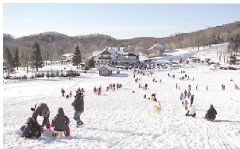
Lanska snežna idila na Lokvah

Kot je za Primorski dnevnik včeraj pojasnila načelnica Saksidova, ponudnik