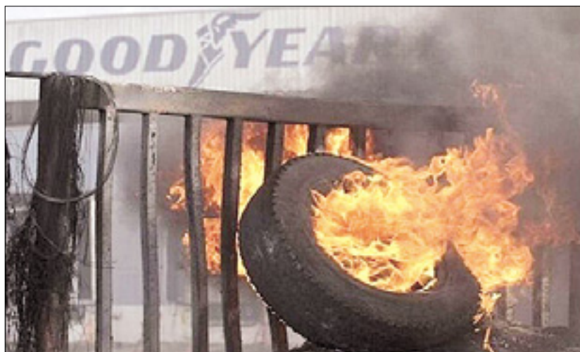
Blokada pa se je včeraj popoldne končala s prihodom policije