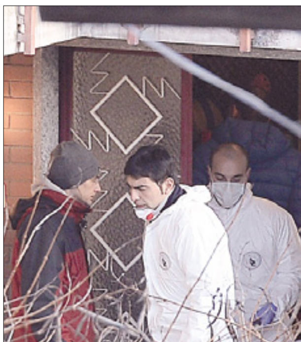
Izvedenci karabinjerjev med pregledom vile