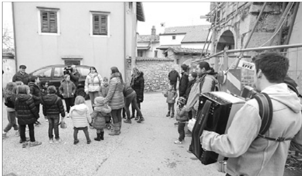
Kriški otroci so koledovanje pričeli ob cerkvi Sv. Roka, ki je še vedno žal zaprta