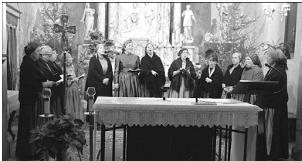
Levo nastop ženske skupine Stu ledi v cerkvi sv. Janeza Krstnika v Boljuncu, spodaj pa zbora Jacobus Gallus v stolnici v Miljah

Ob koncu tedna koncerta v cerkvi v Boljuncu in stolnici v Miljah, noč pa še v cerkvi na Katinari