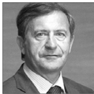
Minister Karl Erjavec

Tudi v Avstriji so bili po njegovem mnenju narejeni pomembni koraki v odnosu do slovenske manjšine. Glede Madžarske pa je izrazil pričakovanje, da bo v tem mesecu končno odprta cesta Verica-Gornji Senik. Glede splošnih odnosov s sosedami je ocenil, da so na splošno dobri in prijateljski, vendar je z vsako tudi kakšno odprto vprašanje. S Hrvaško ima Slovenija dve odprti vprašanji. Glede meje med državama, ki se rešuje z arbitražo, bomo morali spoštovati odločitev, ki jo bo sprejelo arbitražno sodišče, je de-