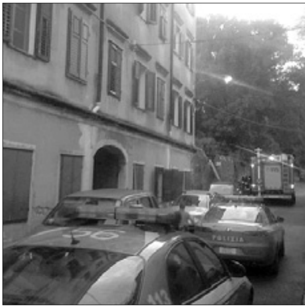
Gasilci in policija pred hišo v Ulici Scala