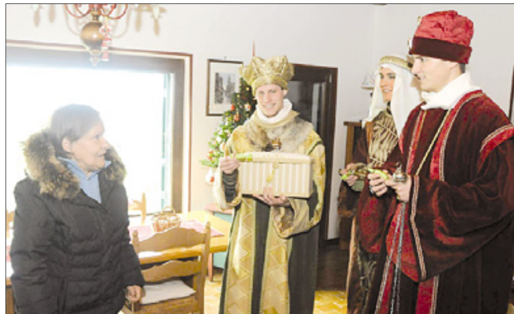
Trije kralji v Števerjanu