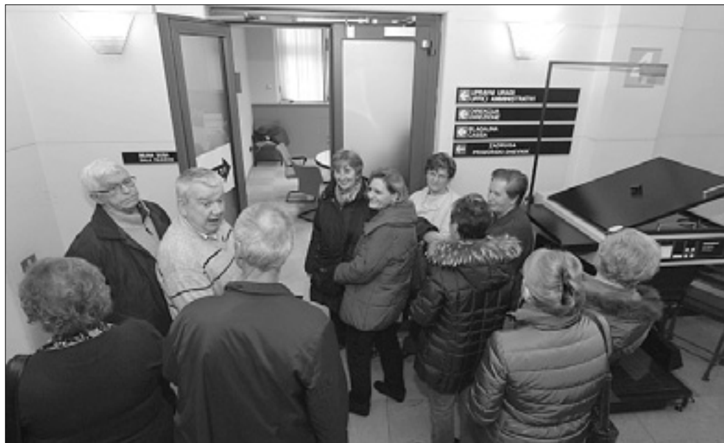
Najbolj zvesti izletniki so si tako zagotovili mesto za potovanje