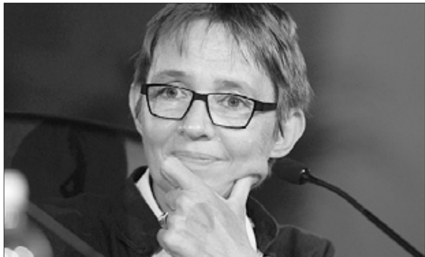
Dobitnica 47. zlatega sv. Justa, pisateljica Susanna Tamaro