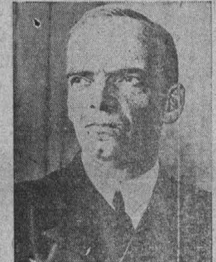
Na sliki je nemški admiral Otto Schniewind, ki je bil imenovan na mesto admirala Luetjensa, ki je izgubil življenje s pogreznjeno nemško oklopnico Bismarck.