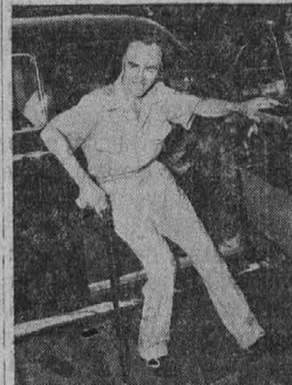
Na sliki je slaven ameriški letalec, ki se je proslavil v taleo kapitan Eddie Ricker-Franciji tekem prve svetovne vojne. Nedavno je bil med potniki v nekem ponesrečenem letalu, ob kateri priliki je dobil težke poškodbe, toda je zdaj že izven nevarnosti in izven bolniške postelje.

trajska pokrajina, ki je tako rekoč še nova slika, zelo pomembna pa jasna. V tej sliki bomo videli vse pokrajine od Rakeka preko Cirknice, Begunj, Žerovnice, Martinjak, Stari Trg in kar je vmes. Za tem bo sledila za 10 minut sijajna manifestacija S.Z.Z. na Providence Heights, kjer so razdelile uniformiranim članicam Zvezin simbolj.