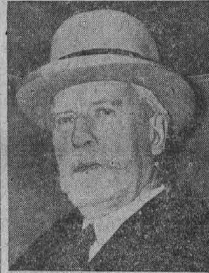
Na sliki je Charles Evans Hughes, ki je odstopil kot predsednik vrhovnega sodišča Zedinjenih držav.