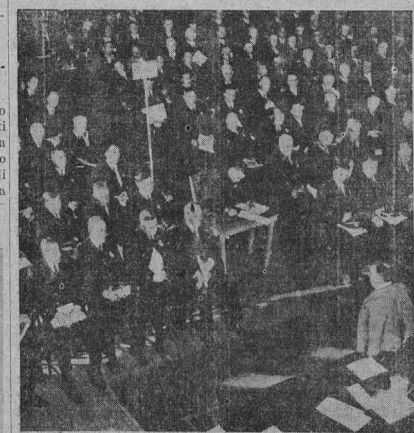
Newyorški župan La Guardia (na desni), ravnatelj civilne obrambe, daje newyorškim policijskim uradnikom instrukcije za registracijo 63,000 čuvajev proti zračnim napadom, katere registracija se bo zdaj pričela.