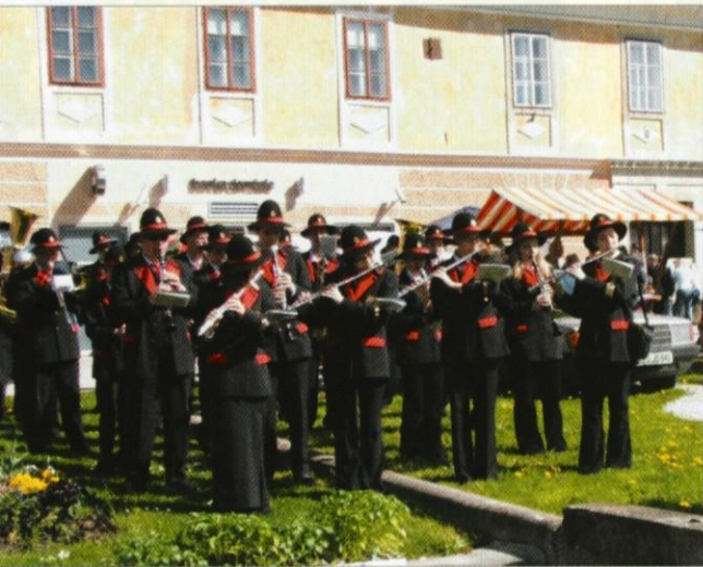
Na Peregrinovem sejmu