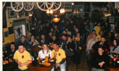
Obiskovalci Propagandnega večera

Več informacij o našem klubu si lahko pribrskate na spletnem naslovu www.mkrokovnjaci.com .