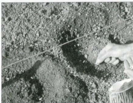
Setev semen raznih zelenjavnic

so po cerkvenem koledarju posvečeni svetnikom Pankraciju, Bonifaciju in Servaciju. Ti so med ljudmi znani kot "ledeni možje", potem lahko sejemo na prosto seme za mraz občutljivih zelenjavnih rastlin in sadimo. Sadik paradiznika, kumar, buč, lubenic, paprike ne smemo saditi