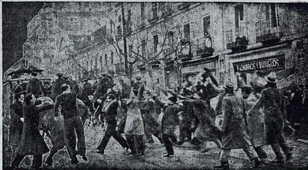
Na Španskom po volitvaj. Demonstranti so napadnoli policijo, kak vidimo na sliki

Društvo narodov je predlagalo v Rimi i Adis Abebi, v glavnom mesti dve sovražnih držav, naj stavita boje i se naj začnejo priprave za mir. Obe državi sta se toj želi podvrgele i sta stavile vse sovražne napade, kajti obe stakotrige društva narodov. Če pogajanja ne bi uspela, se začne znova boj. Bog daj srečen izid pogajanjem.