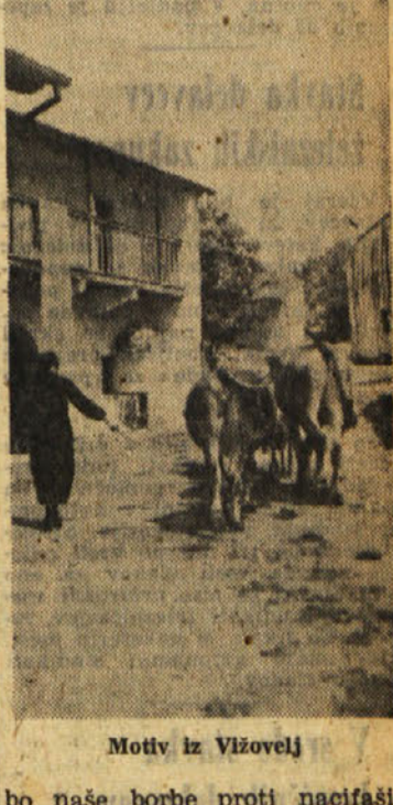
Motiv iz Vižovelj

Blazina je kupil to hišo od nekega Gabrovca. Še gre o njem glas, da je bil to mož posebne vrste. Po utnem izročilu naj bi bil zbežal iz semenišča, kjer se je naučil brvati iz trnih bukav. Ko so ga Francozi lovili na vojašično, jim je zbežal proti morju, in ko ni mogel nazaj, je skočil v morje in plaval. Birči pa so pravili - da bi se opravičili -, da je začel hoditi po vodi in ga zaradi tega niso mogli ujeti. Mož je s svojo prbrisanostjo tako obogatel, da je imel zlat vozček, ki je držal hleb kruha. Z raznimi coprnjami je izvažil iz vrazvevirjev, ki jih je bilo takrat mnogo in jih je nekaj še danes prirnemo nagrado.