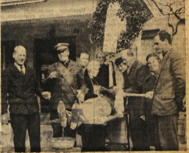
V Padričah so se reveža usmili. Na mrtvaškem odrju je ležal ves dan pred gostino. V žalnem sprevodu so ga ob mraku nesli po vasi, nato pa so ga «balzamirali», da se bo ohranil do prihodnjega leta