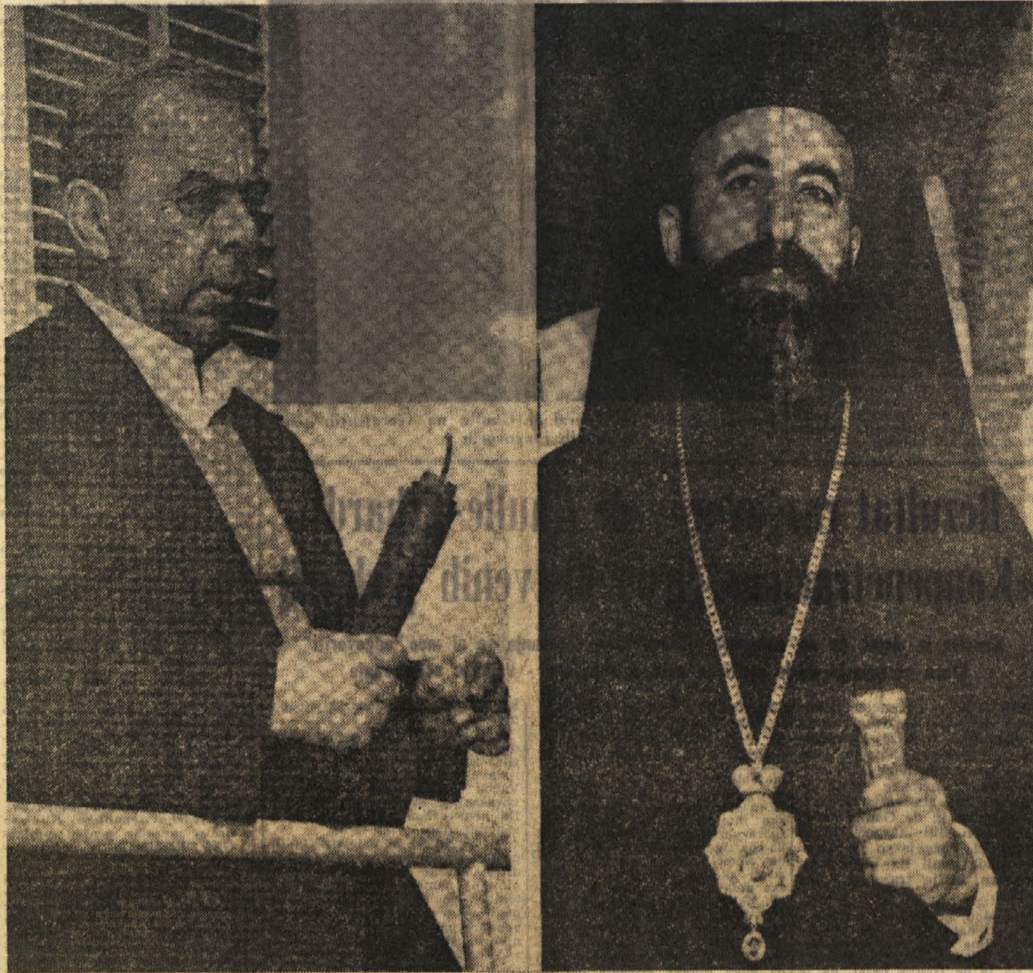
Levo: voditelj ciprskih Turkov in podpredsednik ciprske vlade dr. Fazil Kučuk. — Desno predsednik ciprske vlade in voditelj ciprskih Grkov nadškof Makarios...