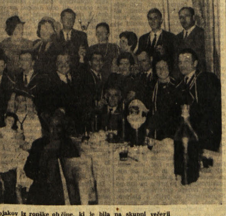
Skupina naših rojakov iz ronške občine, ki je bila na skupni večerji

L. 1910 je vas dobila železniško postajališče, kar je takratno obćino Mavhinje stalo 14.000 kron. Na dan otvoritve je bila posebna slavnost; železniško o sebe vsakega osebnega vlaka je dobilo po liter vina in virzinko. Postajališče je služilo naraščajočim potrebam Vižovelj, Sestjana, Cerovelj in Mavhini. Datum 16.8.1944 spada v do-