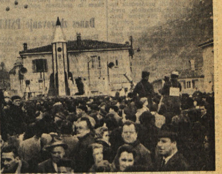
Pustne prireditve so bile, kot vsako leto, v mestu in na podeželju. Na pepelnico sredo pa je bilo slovo od pusta bolj množično v Skednju in v Boljuncu. V Skednju so ga po stari navadi sežgali, v Boljuncu pa izstrelili v vesolje ob prisotnosti velikega števila domačinov in meščanov, katerim so brezplačno postregli z vinom, polenovko, polento in repo