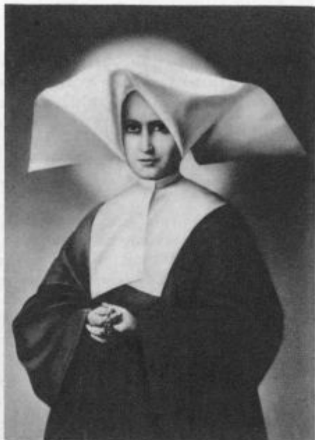
Blažena Katarina Laburé (prišleta blaženim 28. majnika)

svetinj več svetniških rokopisov, med njimi pismo, v katerem popisuje sv. Janez Berhmans proglašenje sv. Ignacija za svetnika, in pismo sv. Petra Kanizija, ki z njim priporoča sv. Frančišku Borgiju sv. Alojzija, naj ga sprejme v Družbo Jezusovo. — V sobici sami, v kateri je živel in umrl sv. Stanislav, je lep kip svetnika, ležečega na postelji prav na tistem mestu, kjer je stalo njegovo smrtno ležišče. Glava, roke in noge svetnikove so iz belega, oblačilo iz črnega, žimnica in vzglavje iz rumelega marmorja. Toliko resničnosti je v tem kipu, da čutiš ob njem, kakor bi stal pri mrliču, ki je pravkar izdihnil. Tisti svetnikov deviški glas, s katerim je zagotavljal, da bo Marijino Vnebovzetje že v nebesih praznoval, se zdi, da še zmerom skrivnostno šepetuje po tem prostoru... Stanislav, mladenič-orjak, bolj bogat neminljivih del nego minljivih let, z Alojzijem in Berhmansom Ignacijeva neumrjoča slava, ki si zgodaj končal, pa dopolnil veliko časov — lepo nam je bilo moliti ob tvojem grobu in misliti na tisto višje, za kar smo rojeni... in misliti, kako si nujno prizadevajmo oti ta begoči čas, da nemirni pohitimo v večna počivališča! 5