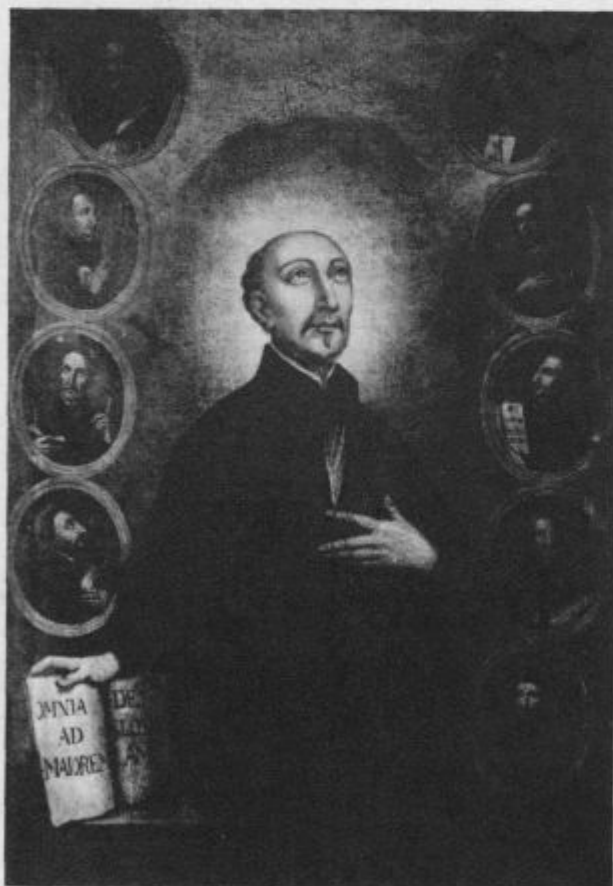
Ljubljana, uršul. samostan

Z devetletnim ribičevim sinkom se varneje prepelješ čez Savo kot s 70 letnim doktorjem.