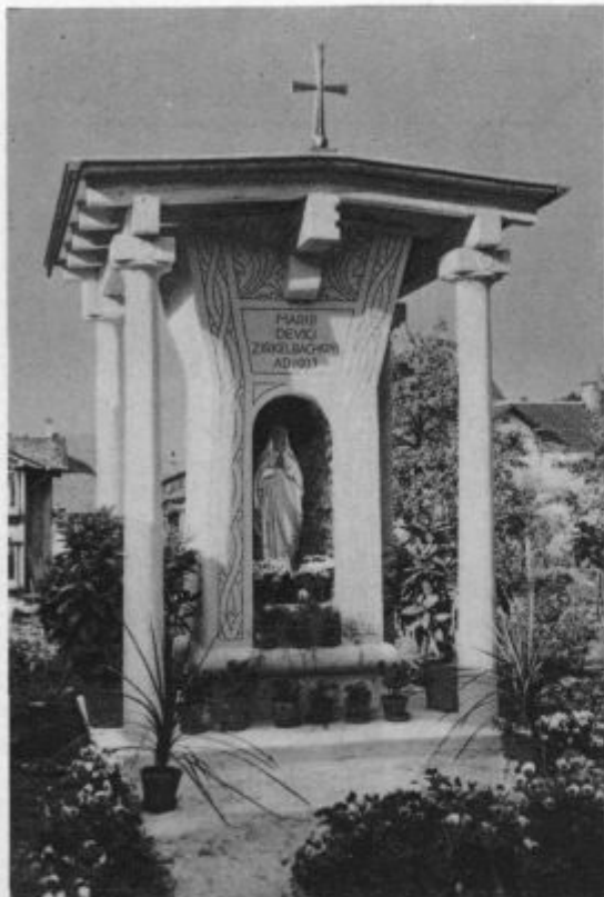
Načrt prof. Plečnika