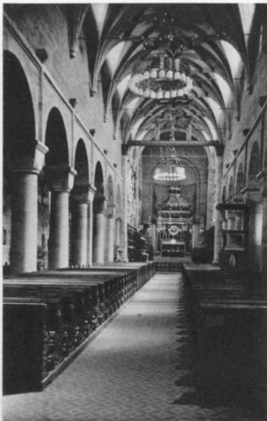
Notranjščina v opatijski cerkvi v Sekavi

so sezidali oba nova v romanskem slogu. Vse to, posebno pa strogo samostansko življenje in pa krasno koralno petje, je slavo sekavskega samostana od dne do dne večalo. Celo s Hrvaške so skoraj redno prihajali o velikih počitnicah bogoslovci v Sekavo, da so se vežbali in šolali v koralnem petju. Menihe so radi vabili v samostane in semenišča, da so vodili duhovne vaje, pa tudi v bližnje vasi in mesta, da so imeli svete misijone, ali pomagali pri dušnem pastirstvu. Svetovna vojna in pa nje ne zle posledice so to bujno procvitanje sekavske opatije na mah prekinile; dà, l. 1922. se je celo zdelo, da bodo opatijo popolnoma uničile.