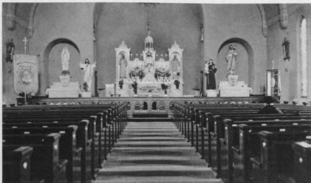
Slovenska cerkev sv. Cirila in Metoda v Rock Springsu v Ameriki

članov v najoddaljenejših deželah... Zdaj počiva »zvesti in modri hlapec« že stoletja v kraljevskem tem grobu, ki mu ga je ustvarila skupna ljubezen njegovih po vsem svetu delujočih sinov. Štirje pristenski stebri oltarja so obloženi z lazurnim marmorjem ter imajo podstavke in vrhe iz pozlačenega bronu. Svetovna obla v marmornatem reliefu presv. Trojice, ki jo je sv. Ignacij posebno častil, je iz enega samega kosa lazurja in je na svetu največja in najlepša te vrste. Marmornati skupini ob straneh oltarja predočujeta zmago nad poganstvom