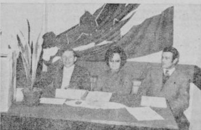
Komisija je ob koncu referenduma ugotovila, da so bistriški trgovci za priključitev

Na pragu novega leta je kolektiva, 45 jih je bilo prokonočno prišlo do že zdavnaj napovedanega referenduma, bti neveljaven. Bistričani bodo po priključitvi obdržališki trgovci odločili, ali so za