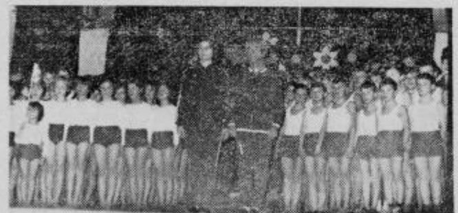
Z akademije ob 40-letnici telesne kulture

Najprej smo občutno povečali telovadišče, ki nam zdaj omogoča bogato vsestransko vadbo, nastope in tekmovanja. Pri planiranju igrišča je bile preneljenih na tisoče samokolnic in premetanah na milijone lonat. Zgradili smo novo kino dvorano z odrom in s tem dosegli, da je telovadnica končno lahko služila samo svojemu prave-