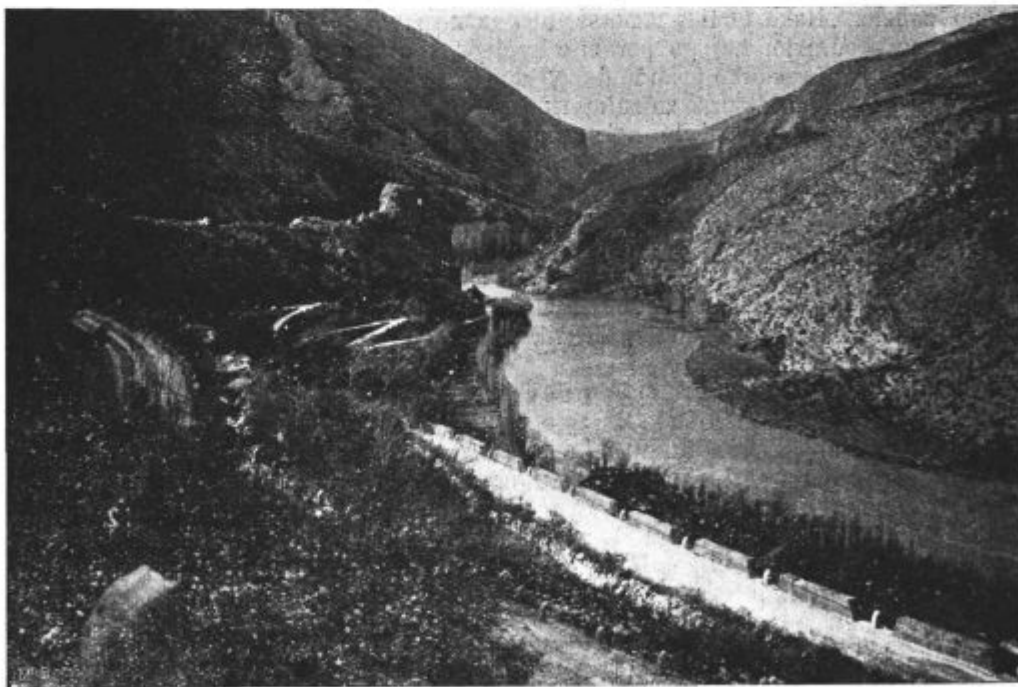
Podoba 77. Pokrajinska slika med Dugiralom in Kraljevcem.

Varčujmo s krušnim žitom in vsak naj skuša po možnosti dolgo z domačimi pridelki izhajati. Od krušnega žita (pšenice, rži, turščice in ajde) ne sme živina ničesa dobiti. Pustimo ga v domačih mlinih mleti za dom in ne zahtevajmo lepe moke, ampak čisto navadno; te je več in je veliko redilnejša.