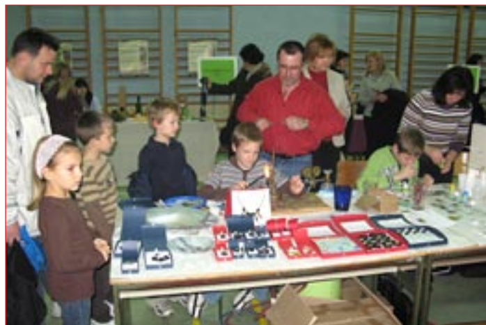
Obiskovalci, tudi mlajši, so se aktivno vključili v delavnice, ki so jih na tržnici pripravili razstavljalci.

»Tržnica poklicev mi je všeč. Najraje bi po končani osnovni