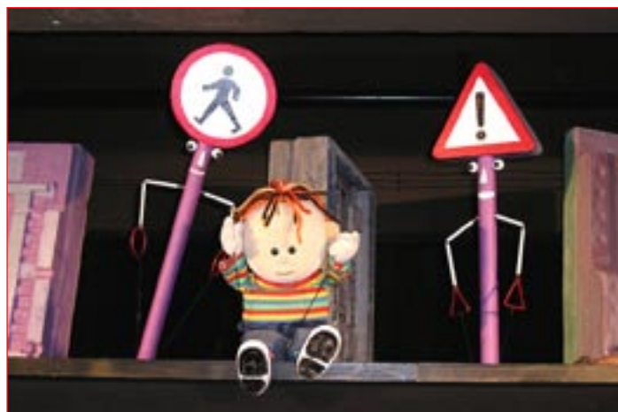
Nacek in znaka.

način, opozarjali na pravila, ki jih morajo kot najmlajši udeleženci v prometu poznati in predvsem upoštevati. Na ta način uresničuje cilje prometne vzgoje v prvih razredih devetletke po