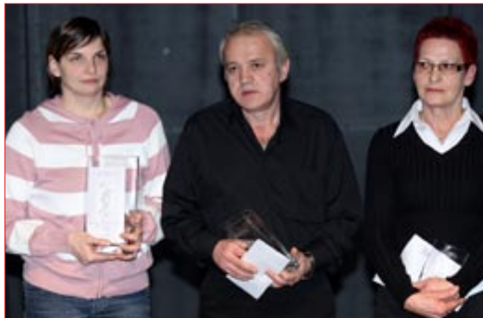
Najboljši med ženskimi ekipami.