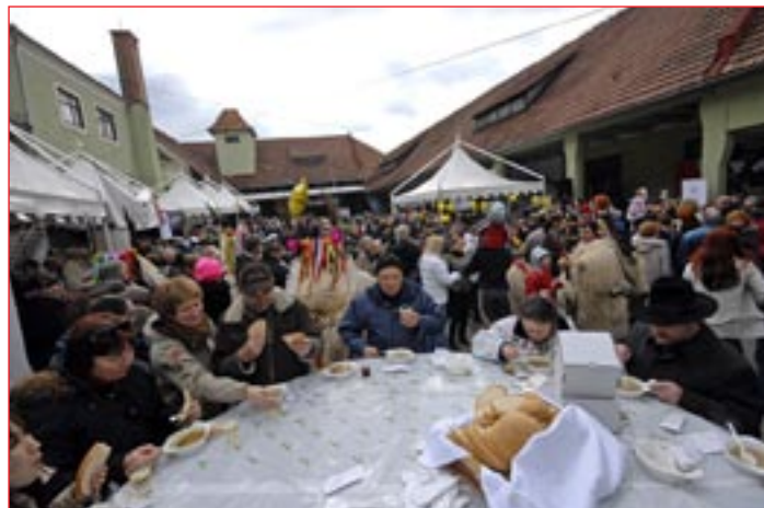
Letos se je v kuhanju najboljše obare pomerilo 23 ekip, njihove izdelke pa je pokušala množica obiskovalcev.

Da je tudi z druženjem in povezovanjem številnih podjetij možno pomagati tistim, ki so se znašli v stiski, so vnovič dokazali ptujski lion, ki si za organizacijo tako velikega dobrodelnega dogodka zaslužijo vse pohvale.