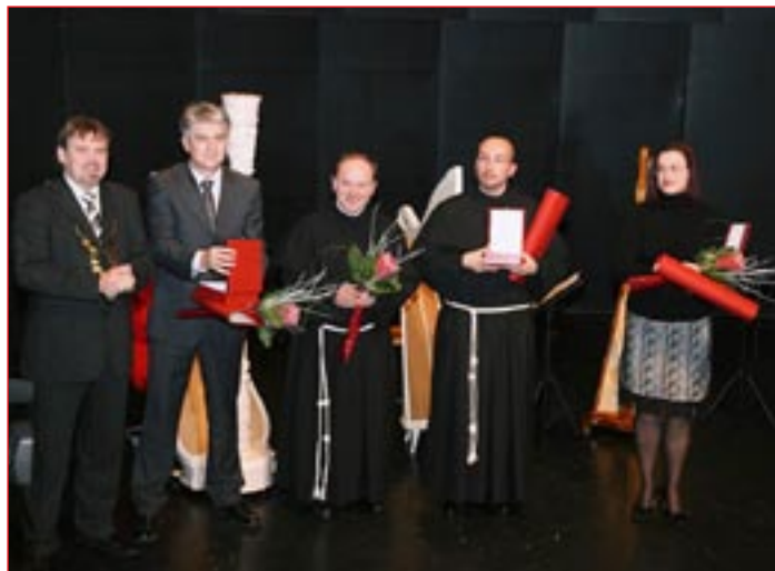
Prejemniki priznanj MO Ptuj in ptujski župan.