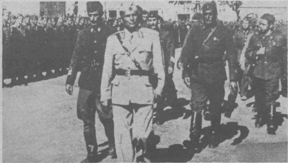
Vrhovni komandant NOV in POJ Josip Broz — Tito pregleduje enote 26. divizije na Visu 12. septembra 1944. Na sliki levo od maršala Božo Božović, komandant 26. udarne dalmatinske divizije, v sestavi katere je bila tudi III. prekomorska brigada — Stane Bobnar je bil tedaj po Titovem ukazu komisar te brigade