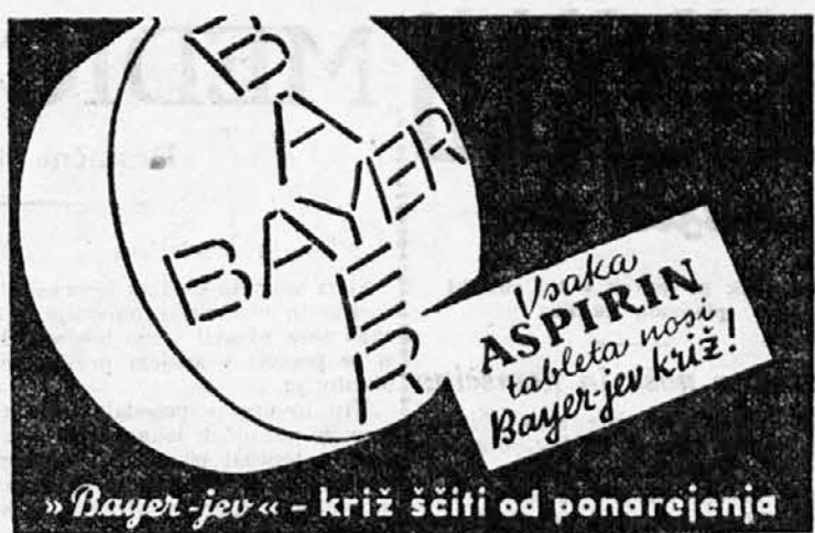
»Bayer-jev« - križ štiti od ponarejenja

Ako je v vaših odgovorih dosti različnih števil, potem je vaš značaj umerjen in uglajen. Ako se pa kakšna številka v vaših zapisih večkrat, ali celo šestkrat ponavlja, potem pazite, kajti to dokazuje, da v vašem značaju za to ali ono črto ni potrebne protuteži. Pozor torej, kajti tudi čednost utegne postati nevarna, če je je preveč!