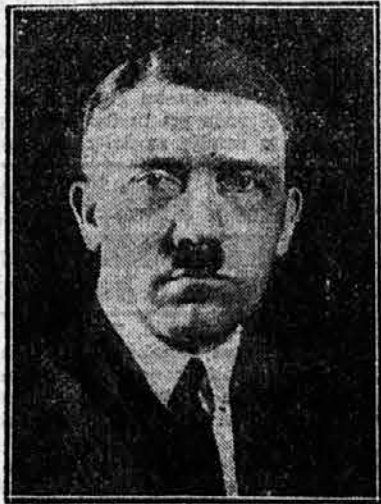
Führer Adolf Hitler

je v nedeljo tri ure govoril o uspehih petletnega vladanja narodnih socialistov.