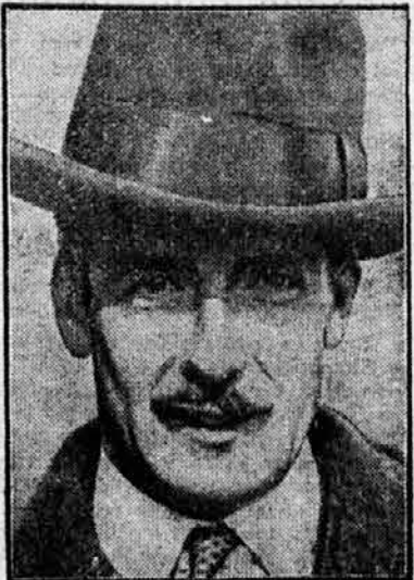
Sir Anthony Eden,

je v nedeljo zmagal nad zunanjim ministrom Ednom z zahtevo po takojšnjih pogajanjih z Italijo.