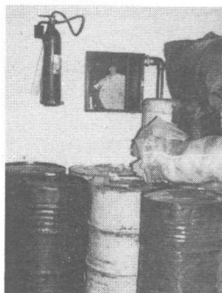
Založen gasilni aparat in zidni hidrant, ki ni zvezan z omrežjem (Silvaproduct)

Komisija s tem pregledom stanja na področju požarne varnosti dela še ni zaključila, ampak ga zavzeto nadaljuje v upanju, da nam bo kmalu lahko poročala o boljšem stanju na tem področju.