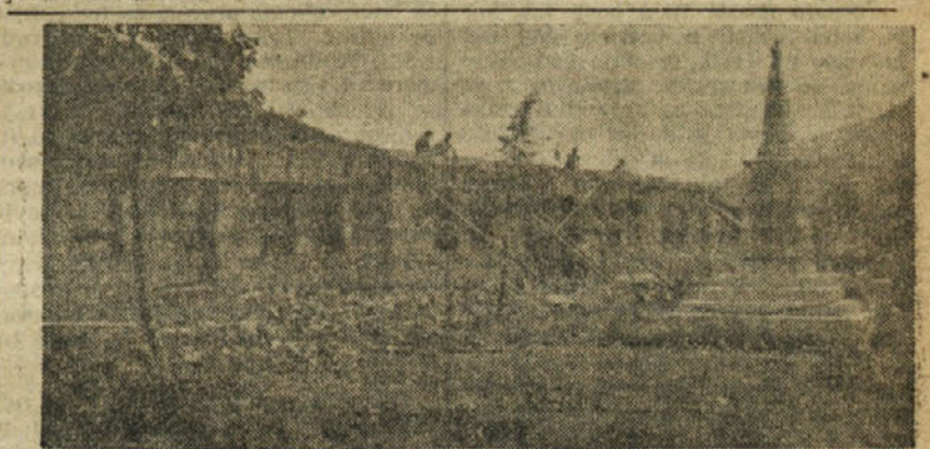
Združni dom v Rihemberku bo kmalu pod streho

Sebi smo ustvarili svobodo — prostost v najširšem pomenu besede, svojim otrokom pa s sedemletkami možnost ustvarjanja čim boljšega življenja, ki pa sloni na znanosti, katere temelje postavlja šola.