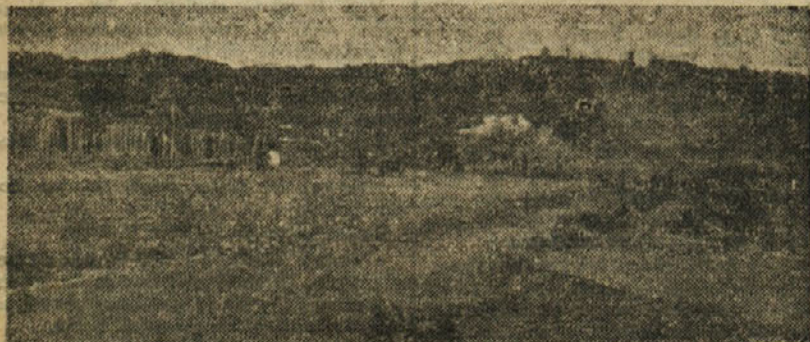
Delo na glavni cesti proti Sempetru napreduje

Nabiralec bodo prejeli poleg plačila tudi nekaj živeža, oblek in obutve.