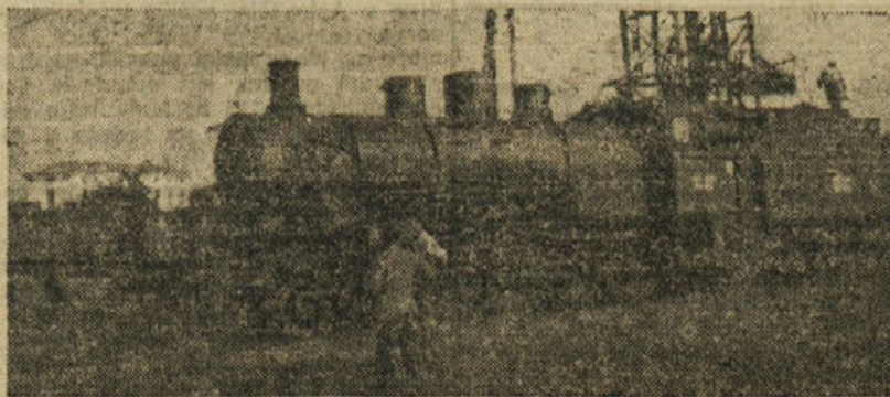
Obnovljena lokomotiva na čast V. kongresu KP Jugoslavije, delo sindikalno podružnice kurilata - Gorica