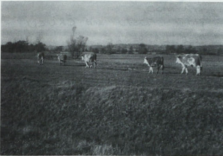
“Na pašo, proti mostu na Črncu, prek na vejke.”

Vse od časa Marije Terezije, ko je s svojim patentom potrdila skupno pašo, pa vse tja do leta 1984, ko so jo z melioracijami in komasacijami odpravili, je bila na travnikih v pesniški dolini skupna paša. Vsako leto se je začela po mali maši in je trajala tja do martinovega. V tem času so kmetje združili svoje travnike za skupno pašo. Živina se je lahko pasla kjerkoli se je hotela. Pravico skupne paše so imeli vsi, ki so imeli svoje travnike v dolini, kmetje in želarji, pa tudi kočarji in viničarji, ki jim je kmet dal čez leto v najem talco travnika. Nekateri pa so si po mali maši kupili pravico paše, ki so jo morali ob martinovem s plačilom v skupno blagajno poravnati na pašniku.