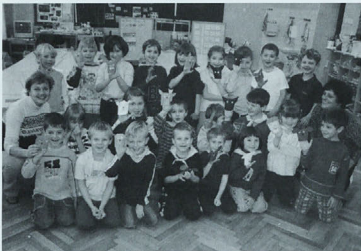
Slika 1: Učenci 1. razreda devetletke z učiteljicama.

Vstopili smo v program devetletne osnovne šole s prvim in sedmim razredom. Na ta korak smo se intenzivno pripravljali že več let in verjamem, da lahko učencem ponudimo vse novosti, ki jih ponuja prenovljeni program.