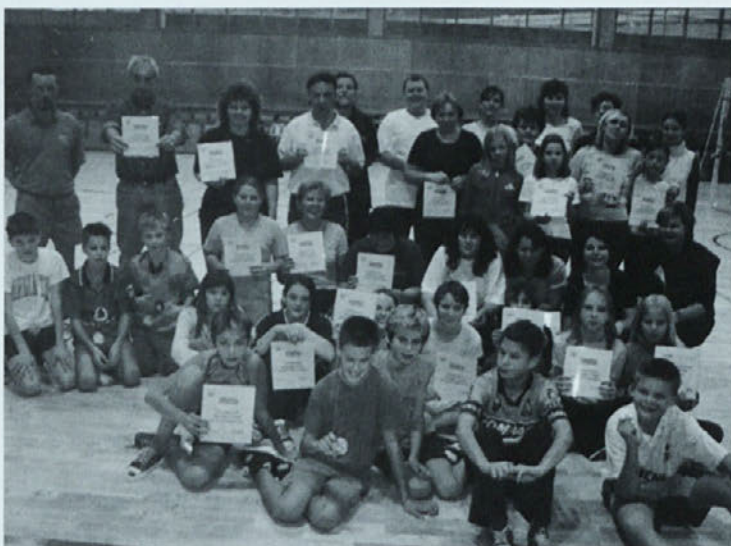
Slika 2: Bili smo zmagovalci.

Ob zaključku prvega redovalnega obdobja smo organizirali tekmovanje v odbojki med učenci in delavci šole. V zelo borbenih tekmah so bila dekleta na obeh straneh izenačena, pri fantih pa je ekipa delavcev šole, kljub pomoči župana, izgubila.