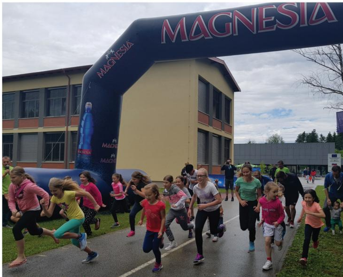
Zmagovalec otroškega teka.