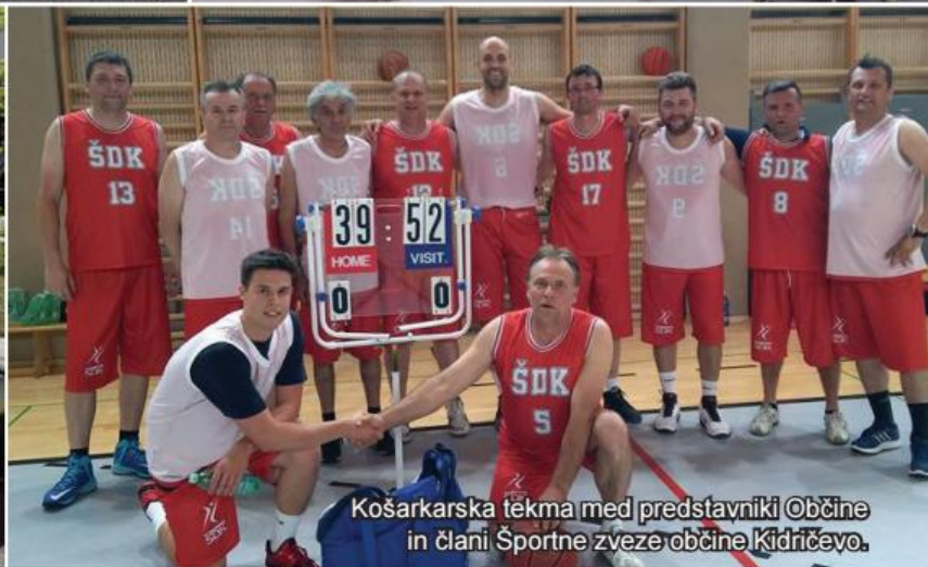
Košarkarska tekma med predstavniki Občine in člani Športne zveze občine Kidričevo.