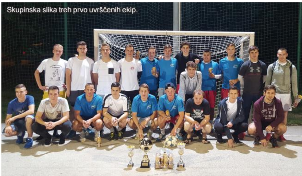
Skupinska slika treh prvo uvrščenih ekip.