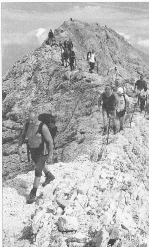
100. pohod železarjev na Triglav