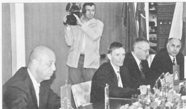
Minister se je sestel z vodstvi SIJ-a, Metala Ravne, Nožev Ravne in Sistemske tehnike.