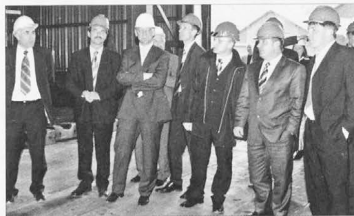
Ogled kovaške stiskalnice

Seveda smo spregovorili tudi o investicijah in privatizaciji. Zavzemam se za postopno, premišljeno privatizacijo, ki bo potekala tudi in predvsem s sodelovanjem z upravami družb, kajti želimo, da bo privatizacija razvojno naravnana, v luči iskanja ustreznih strateških partnerjev, ki bodo z vlaganji omogočili nadaljnji razvoj družb, tako Metala Ravne kot drugih družb. Seveda je cilj privatizacije tudi uspešnejše upravljanje stroškov in nenazadnje to, kar je vlada že večkrat napovedala – postopen umik države iz gospodarstva. Še enkrat poudarjam, da se