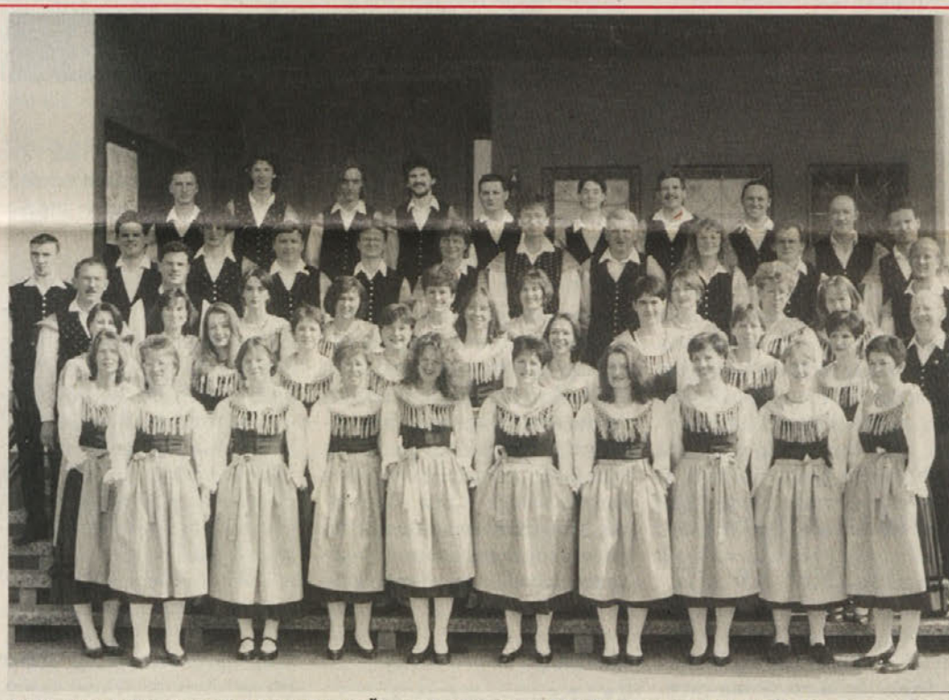
Velik uspeh Danice! MePZ Danica iz Šentprimoža je pretekli teden na 4. koroškem zborovskem temovanju dosegel najboljše ocene in se vrnil z odličjem. stran 5

In ne nazadnje se v luči tega postavlja tudi vprašanje dalekoglednosti slovenskih elit, ki so – vsaj nekatere – v preteklih letih tudi gradile svojo populistično politiko na ločevanju po etničnih kriterijih. -an