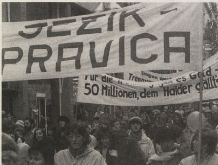
Spomin iz 80-let – protest zoper ločevanje otrok