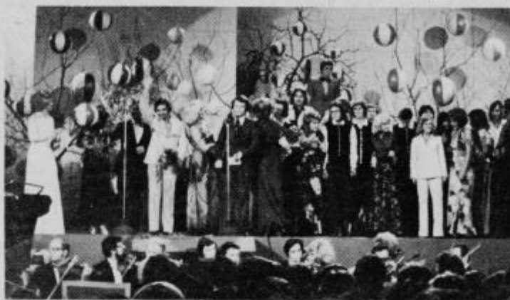
Ob zaključku festivala pa kot po navadi, šopek za vsakega nastopajočega in „Na svidenje prihodnje leto“.

In še strokovna ocena glasbenikov: „Vseh šestnajst popevk, ki smo jih slišali v dvorani C je bilo na višji kakovostni ravni, kot lansko leto in prejšnjih festivalih.“ – Mi pa upamo, da bo prihodnje leto še boljše in kvalitetnejše. M. Ozmeč