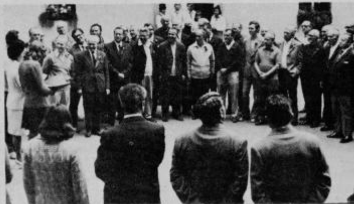
Moški zbor Križkovsky ob zdravici na grajskem dvorišču v Ormožu.