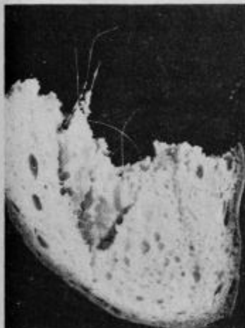
Vrezali smo rezino svežega in sicer zelo okusnega turista in „spominski posnetek“ je tu

Pa so bile, tako smo videli mi in tako je zabeležil tudi objektiv. Za vsak slučaj pa hranimo tisti ostanek kolača še na varnem. Pa dober tek!