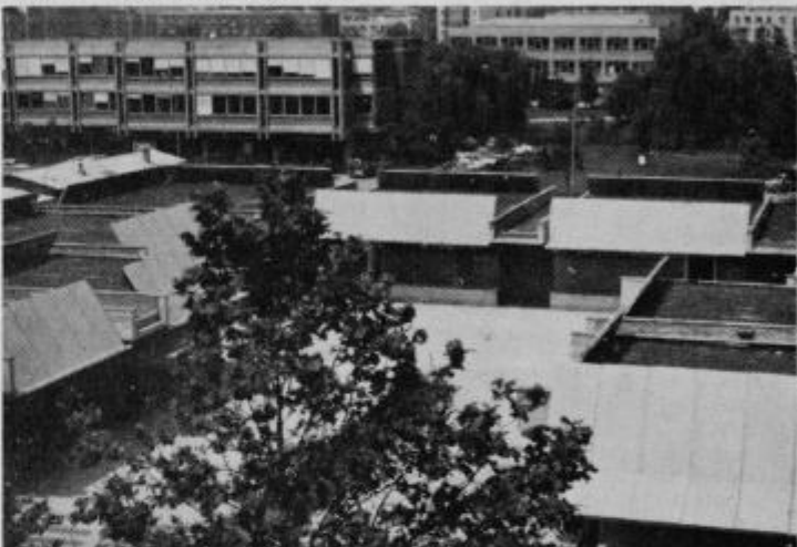
Nova, naj sodobnejša tržnica sredi stanovanjskih blokov v rudarskem središču Velenju, skupna investicija vzhodnoslovenskih kmetijskih kombinatov ter tovarne mestnih izdelkov Košaki — korak naprej k boljši in sodobnejši preskrbi ljudi.