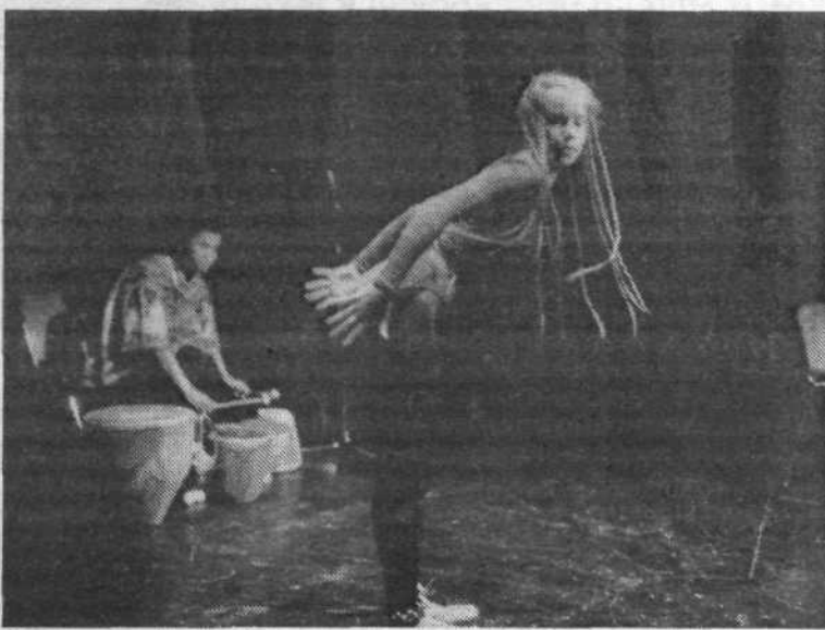
Prizor z uspele prireditve v Cankarjevem domu