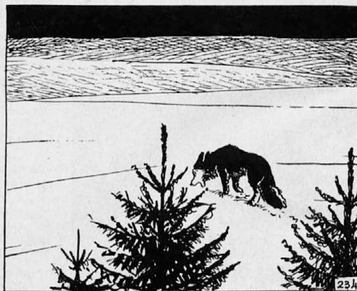
234. Pod drevesi je Baree preležal vso noč in pol naslednjega dne. Šele opoldne se je lahko nekoliko dvignil. Kljub strašnim bolečinam je pogledal proti reki in sovražno zarenčal. V njegovem ranjenem, razbolnem telesu je vstajala divja jeza na volkove. Nikoli več ga ne bo premotil njihov lovski klic, nikoli več jim ne bo tovariš!