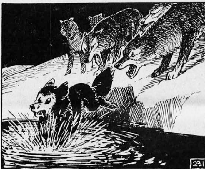
231. Takrat se je Baree spomnil na vodo, na rešitev. Z zadnjimi močmi se je pognal čez siva telesa svojih n'padalcev in skočil globoko v reko. Zobje volkov so hlastnili v prazno. Kot je gozdna reka rešila življenje severnemu jelenu, tako je nekaj trenutkov pozneje rešila tudi Bareeja smrti pod zobmi lačnih, podivjanih volkov.