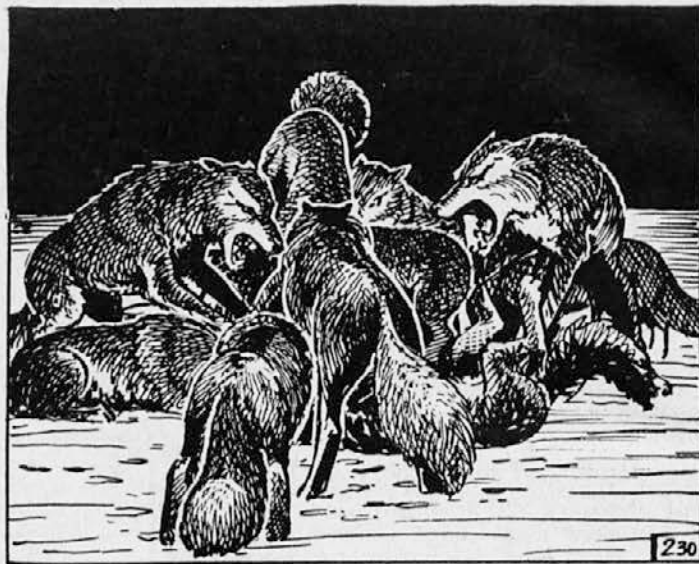
230. Toda Baree je bil za volkove neznanec, pritepenec, zato niso spoštovali pravil borbe. Bili so pobesneli zaradi neuspelega lova. Že se je pognal v boj drugi volk, potem pa je ves trop kar padel na Bareeja. Volkovi bi bili Bareeja gotovo raztrgali na kose, če se ne bi borili prav na obali. Zemlja se je udrla in potegnila volkove s seboj.