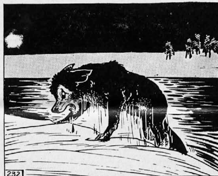
232. Čeprav je bila reka komaj sto korakov široka, jo je Baree le s težavo preplaval. Dokler ni truden zlezal na kopno, še slutil ni, kako hude in globoke so njegove rane. Zadnje noge ni mogel premikati, leva rama je bila raztrgana do kosti, kri mu je tekla iz gobca in iz številnih ran na glavi. Za njim je ostajala v snegu krvava sled.