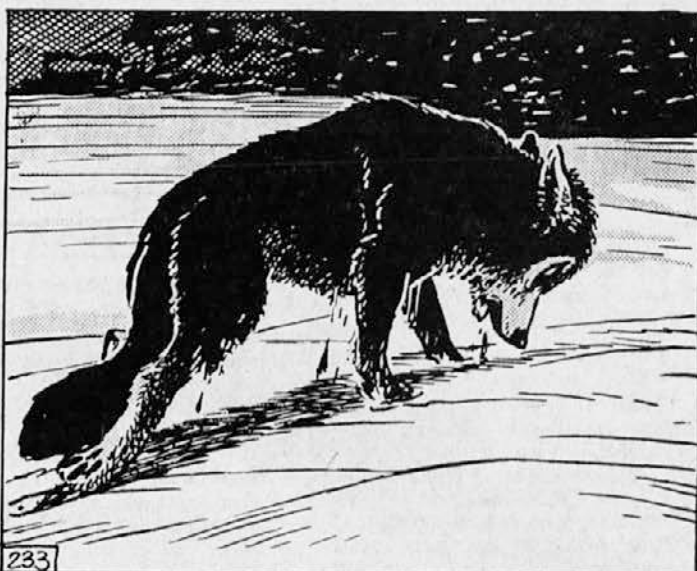
233. Baree je bil skoraj nezavesten. Videl je slabo, saj je mel oči zalite s krvjo. Čez nekaj časa ni več slišal divjega zavijanja volkov z onega brega, ni več čutil, ali je dan ali je noč. Vlekel se je dalje, proč od reke, na srečo prav proti prilikavim drevesom na rožju gozda. Na pol mrtev je pod njimi padel na tla.