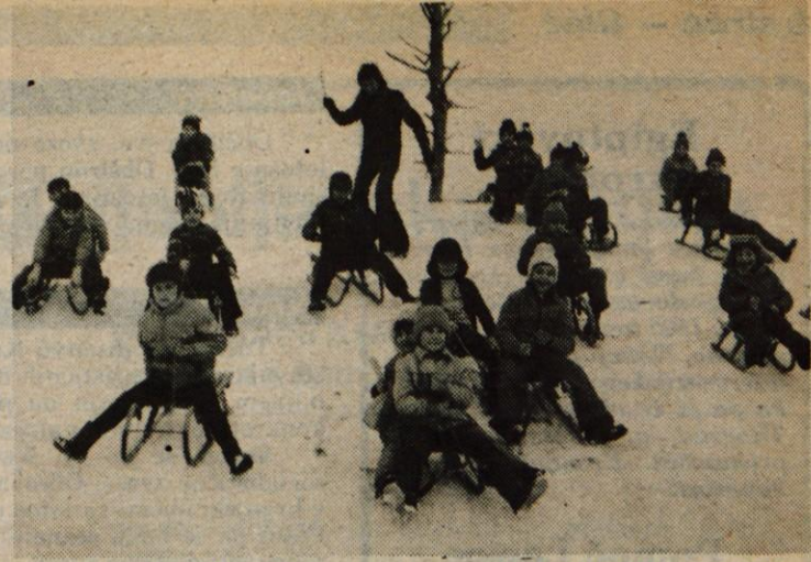
SNEG NADLOGA IN VESELJE – Prvo velja predvsem za udeležence v prometu. Na klancu proti Bledu je obtičala cisterna in zaprla promet. Le s težavo so jo spravili do vrha. Pravijo, da se pozimi na tem klancu to pogosto dogaja! V Trziču pa povzroča največje negotovanje slabo očiščena cesta od Peka do Bombažne predilnice in tkalnice. Sneg jo je še bolj zožil in postavil na kocko varnost udeležencev v prometu. Otroško veselje pa je povsem razumljivo... (jk)