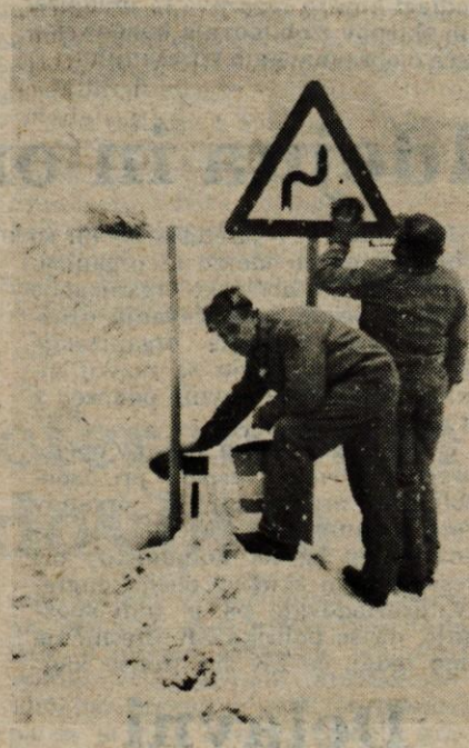
Ena od delovnih enot Cestnega podjetja Kranj je tudi na Javorniku, kjer delavci vzdržujejo cesto od Žirovnice do mejnih prehodov na Korenskem sedlu in v Ratečah. Pozimi imajo delavci največ dela s pluzenjem, obenem pa morajo tudi stalno skrbeti za prometne znake ob cesti.