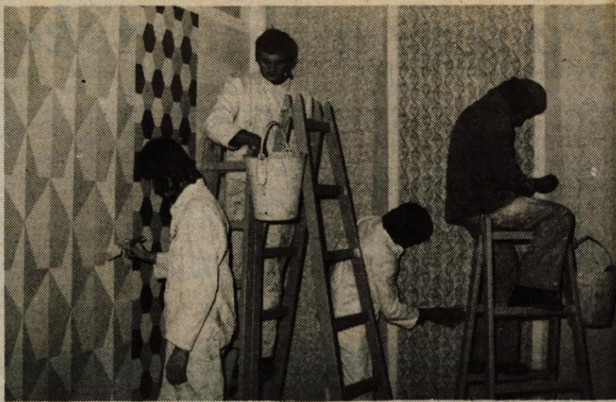
Pri praktičnem pouku v slikopleskarski delavnici

Besedilo: L. Bogataj