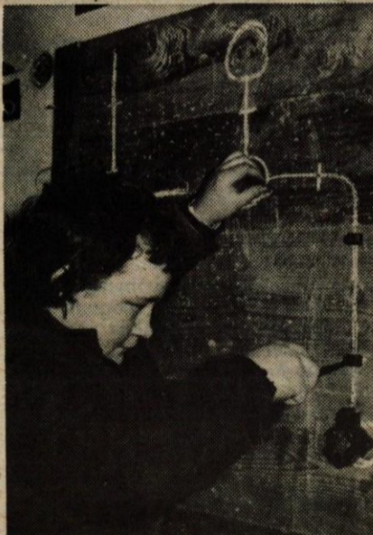
Praktični pouk v elektro delavnici

Poklicna šola je ena od redkih, če ne edina slovenska poklicna šola, ki se redno udeležuje festivalov dela jugoslovanske mladine, ki je vsako leto v drugem jugoslovanskem mestu in katerega pokrovitelj je predsednik republike Josip Broz-Tito.