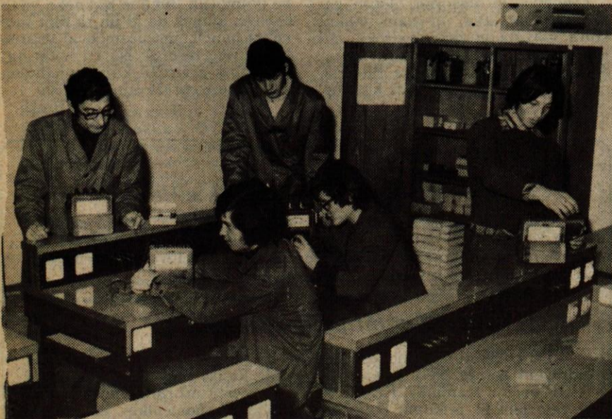
Lani so na šoli uredili elektro laboratorij, kjer se učenci učijo opravljati razne električne meritve.

Pismene ponudbe sprejema splošni sektor podjetja Tiki, Ljubljana, Aleševčeva 52 do zasedbe delovnega mesta.