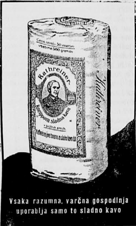
Vsaka razumna, varčna gospodinja uporablja samo to sladno kavo