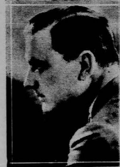
Keneth Harlan znani kinematografski igralec.

Prva dva dneva po velikonočnih praznikih so orožniki aretirali v mariborskem sodnem okolišu in