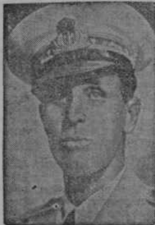
Vojevoda Aosta, poveljnik Italijanske armade v zasedeni angleški Somaliji

Ljutomer. Nastopilo je nekoliko boljše vreme, kar je tudi potrebno, če hočemo, da bo dozorela ajda in koruza. Ljudje že kopljejo krompir. Ne-