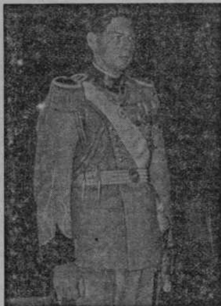
Novi romunski kralj Mihael