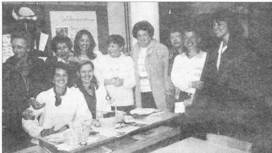
Skupina učiteljic na obisku v osnovni šoli v Mimi.