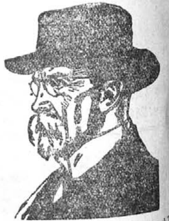
Danes potekata dve leti, kar je umrla T. Masaryk.

V svojem nadaljnjem govoru je Chamberlain govoril o domačih varnostnih ukrepih in o delu ministrstva za informacije, katero je opravičeval in naglasil, da je stališče težko, vendar se prvotne napake popravljajo in bodo v kratkem popolnoma odstranjene. Na vprašanja o ciljih vojne, ki so mu bila postavljena, je Chamberlain opozoril na zadevne prejšnje izjave vlade in sporočil, da se ta vprašanja še preučujejo in bodo zadevni sklepi šele sprejeti. Na vsak način pa ne more biti nobenega govora o kakšni okrnitvi Poljske, kakor tudi ne o opustitvi misli na usodo češko-slovaškega naroda. V debato so po Chamberlainovem poročilu posegli še razni poslanci in ministri.