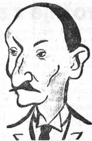
GEORGES BONNET, dosedanji francoski zunanji minister. V novi vladi je postal justični minister. V zunanji politiki je bil še do nedavna zagovornik Monakovega.

ge Franciji. Stalno je deloval za mir. Njegovo ime bo vtisnjeno v srcih vseh mater in pacifistov.