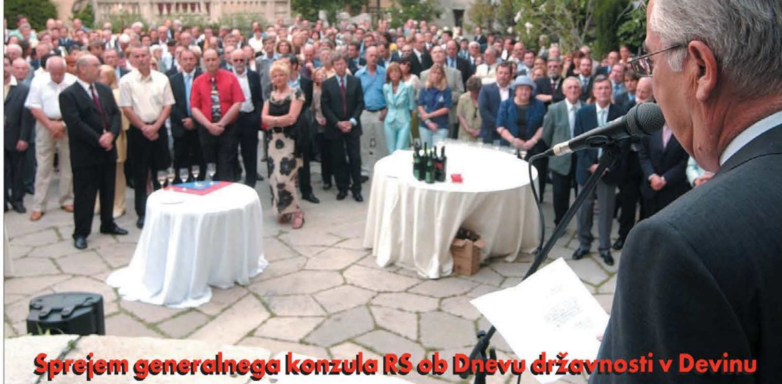
Sprejem generalnega konzula RS ob Dnevu državnosti v Devinu