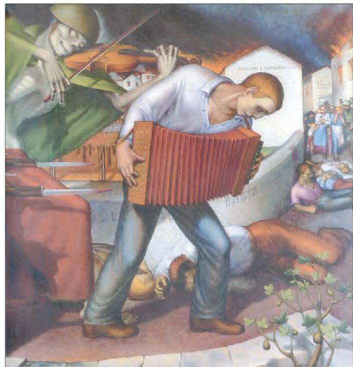
Tone Kralj, Primorski Kurent, 1942, olje/platno

in z resno namero odkrivati resnico. Življenje ob meji več kul-