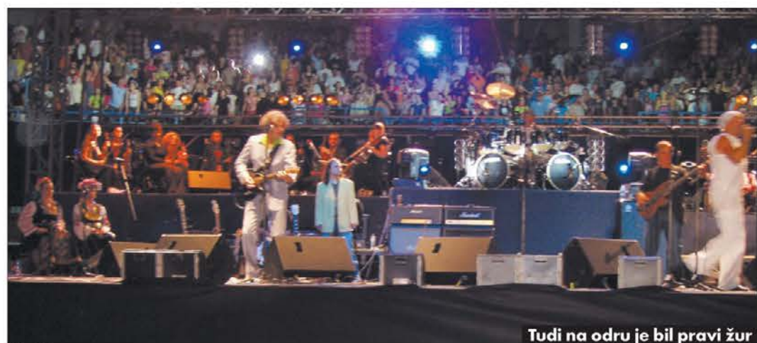
Tudi na odru je bil pravi žur