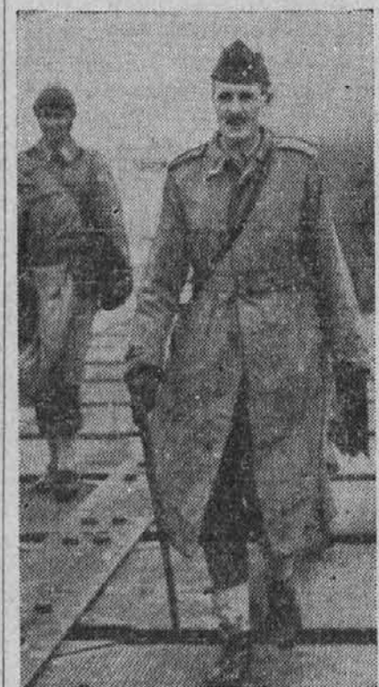
Gen. Jacques Le Clerc is in command of the French troops, who have gone into action against the Germans in France for the first time since the 1940 armistice. The troops, many veterans of North Africa, landed on the Normandy beaches.