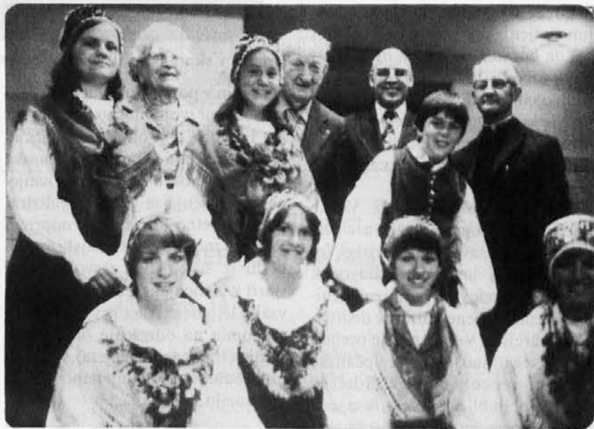
Skupina deklet, ki so se udeležile Baragovih dnevo v Marquettu leta 1978

Baragova misijonska pisma so bila objavljena v nemškem, latinskem, italijanskem in češkem prevodu v Poročilih Leopoldinine ustanove, lyonska Družba za širjenje vere jih je tiskala v francoščini, v slovenskem jeziku pa jih je nekaj objavila