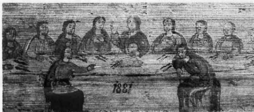
Zadnja večerja. Panjska končnica. Iz knjige Helmut Kroppej, Panjske končnice

je drugo vprašanje. Ali bo vse ostalo le pri protestu — ali pa bo prišlo do propozitivne politike? Bomo videli. Sedaj ima ta močna nova sila možnost, da postavi na tehtnico svoje dejanske predloge in programe.