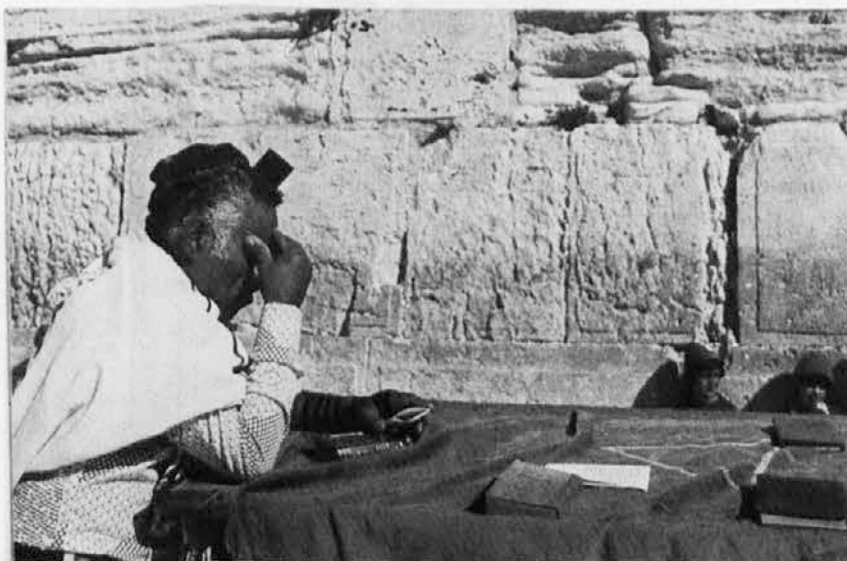
Izraelec premišljuje pred zidom joka v Jeruzalemu. Oblečen je v značilno odelo judovskih molilcev. Zid podpira široki trg, na katerem je nekoč stal Salomonov tempelj in je edini spomin na to nakdanje judovsko svetišče. Ob njem se danes zbirajo judje k molitvi