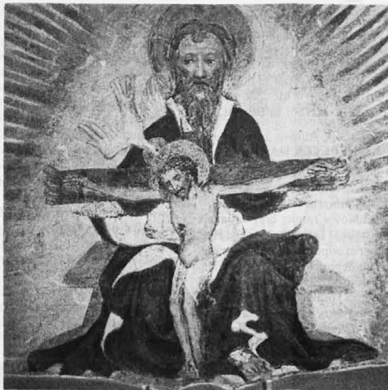
Kristus v skupini sv. Trojice. Cerkev Žalostne Matere Božje v Celju (1413)

suženjstvu tlačili odrasle. V tem ključnem trenutku je nastopil Mojzes; čakala ga je zahtevna naloga: pripraviti obupano ljudstvo na rešitev. Samo božje znamenje mu je tedaj omogočilo biti verodostojen pred narodom: in to znamenje je bilo jagnje, ki ga je moral vsaka družina v napovedani noči odrešiti žrtvovati in z njegovo krvjo pomazati podboje hišnih vrat. V isti noči je Bog poslal angela pokončevalca in, ko se je Egipt zbudil v grozi in krvi, so Hebrejci odprli svoja vrata in pod Mojzesovim vodstvom stopili na pot odrešenja, zvesti Gospodovemu naročilu. Kmalu so se pa znašli med Rdečim morjem in prihajajočo faraonovo vojsko. Strah pred smrtjo je bil močan. Prav na obali Rdečega morja je Mojzes spoznal nekaj velikega: preroško znamenje (žrtvovano jagnje) je bilo resnično in učinkovito, kajti ko ne bi bilo, bi v noči angela pokončevalca ne preživelo niti izvoljeno ljudstvo. Kar pa je znamenje oznanjalo, se mora zgoditi, ker Bog drži obljubo. V uri velike napetosti Izraelove zgodovine je Mojzes v smrtnem strahu stopil korak