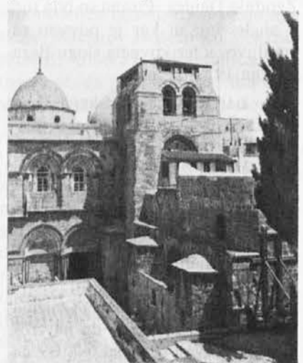
Cerkev božjega groba

Pravi pomen Kristusove Velike noči se nam bogato razkriva v perspektivi starozavezne hebrejske Velike noči, ki je osrednji dogodek judovske zgodovine in najznamenitejši element njene kulturne dediščine. Hebrejska Velika noč je prehod judovskega ljudstva iz egipčanske sužnosti preko odprtega Rdečega morja v obljubljeni deželi. Vse je že kazalo, da se zgodovina hebrejskega naroda izteka, ko so Egipčani ubijali judovske prvorojence in v