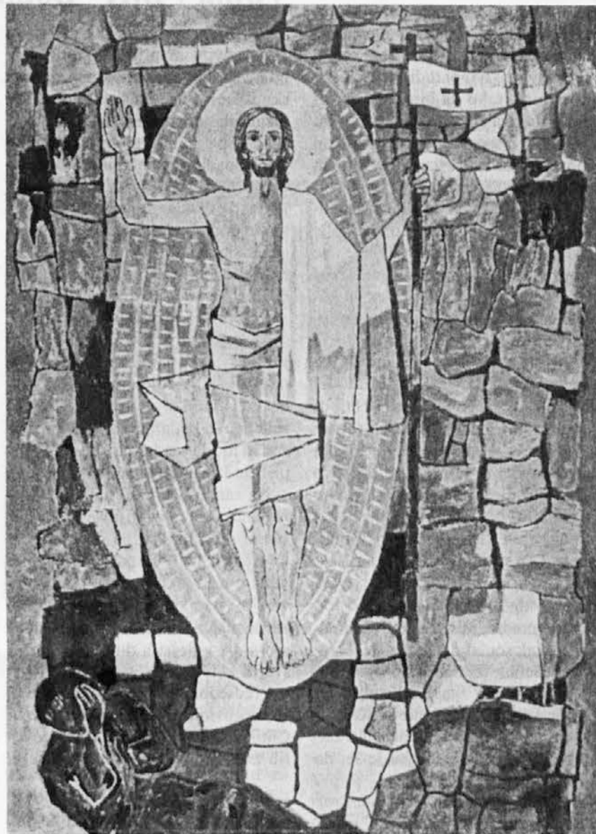
Stane Gregar: Vstali Kristus

V to zmedo pa se ponavlja refren: »Čemu iščete Živega med mrtvimi? Vstal je, ni ga tukaj!«