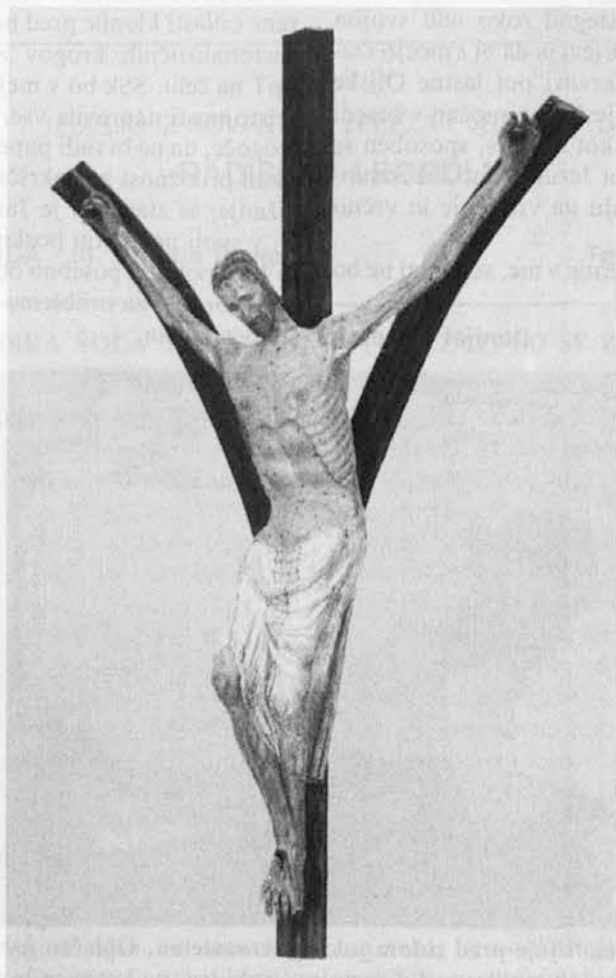
Križani Jezus. Ta lesena plastika se hrani v piranski stolnici in je nastala okrog leta 1370

»Človek ne more doumeti (božjega) delovanja, ki se vrši pod soncem; kakor koli se človek trudi, da ga preišče, ga vendar ne doume; in četudi modri misli, da ga pozna, ga vendar ne more doumeti.« (Pridigar)