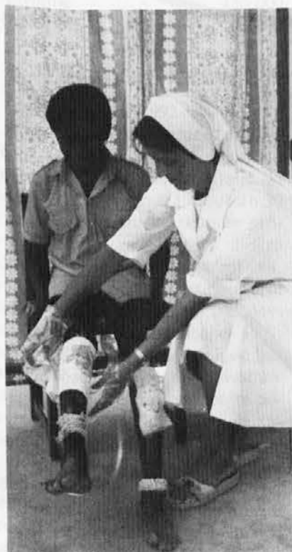
V misijonski ambulanti

V Burkini Faso so leta 1984 doživeli revolucijo, ki jo je izpeljal marksistično-leninistično usmerjen oficir Thoma Sankarà. Prizadeval si je, da bi se splošno stanje v državi izboljšalo in bi vsi prebivalci dovolj pridelali za svoje preživljanje. Režim je bil seveda vojaški in Thoma Sankarà je vodil državo s skupino oficirjev. Njegov »najzvestejši« kolega in prijatelj Blaise Compaorè pa ga je nekaj let od tega z državnim udarom odstavil, ga dal ubiti in se postavil za novega predsednika države. Še vedno je na oblasti, a spoznal je, da mora tudi v Burkini Faso zavladati demokratična ureditev, če hoče država napredovati in se razvijati. Zato so lanskega junija izglasovali novo ustavo, decembra pa so na splošnih volitvah potrdili sedanjega predsednika Compaoreja za prehodnega voditelja države. 24. maja letos bodo v Burkini Faso potekale prve svobodne in demokratične volitve in nanje se pripravlja kar 54 političnih strank in stranic.