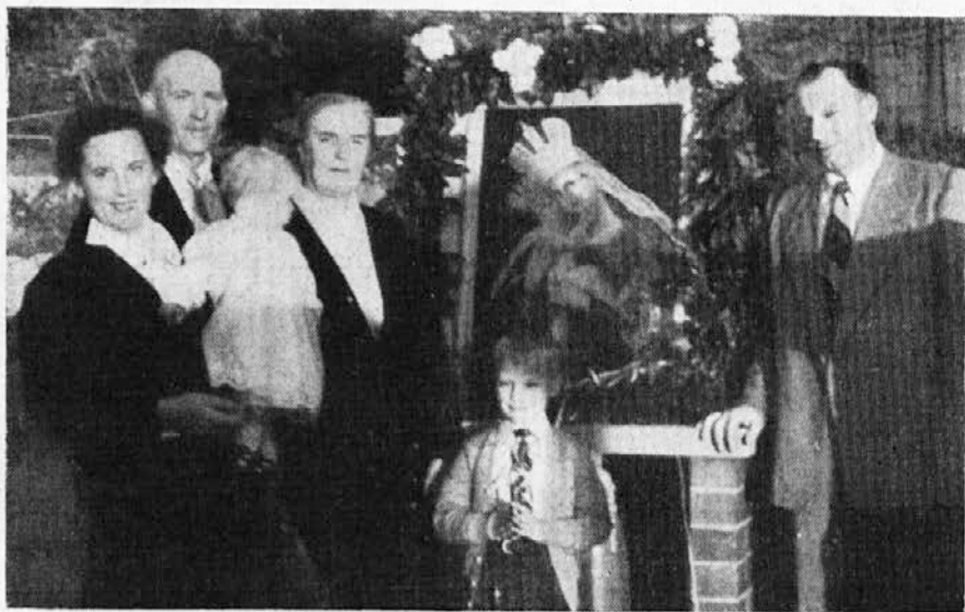
TRIJE RODOVI HRASTOVIH NA ROMANJU