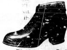
sneške z manšeto