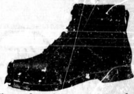
Specialni za snučanje

otročki št. 30 - 35 138 damski št. 36 - 40 198 moški št. 41 - 46 218