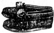
od št. 36 - 42