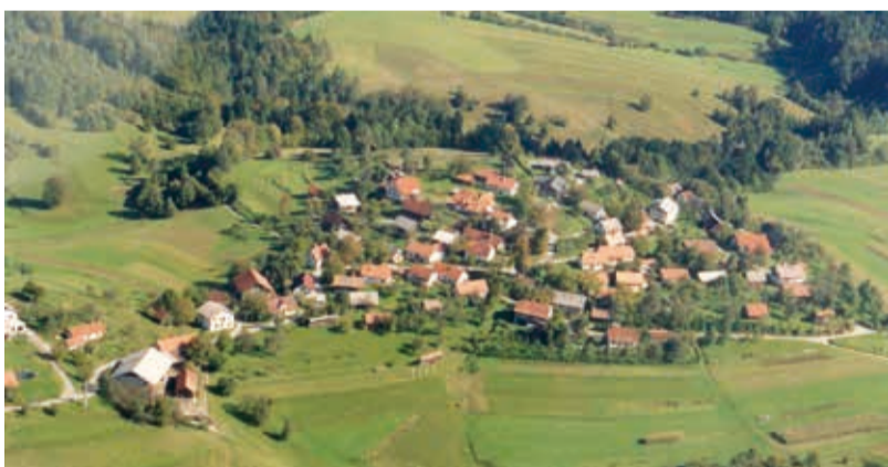
Naši predniki iz starejše železne dobe so se radi naselili na lobih in se ondi utrdili zaradi nevarnosti. Na sliki je nekdanja utrjena (gradiška) vas Male Lipljene. Sledovi utrditve in železarske dejavnosti so za večše oko še dandanes prepoznavni.