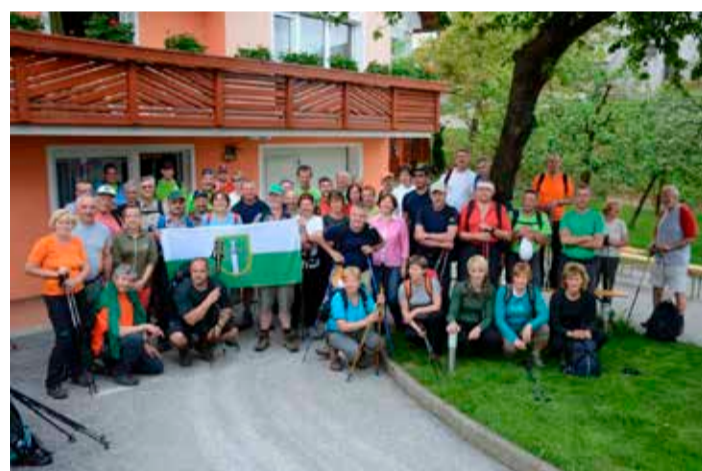
Pri županu doma