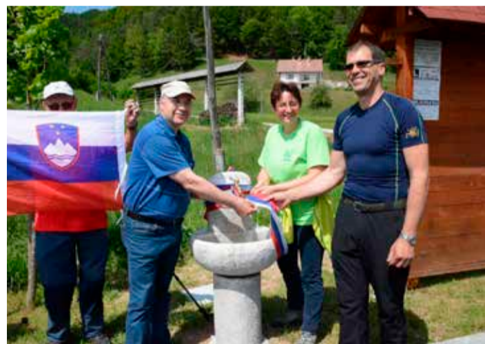
Priloznostna otvoritev v Sobračah