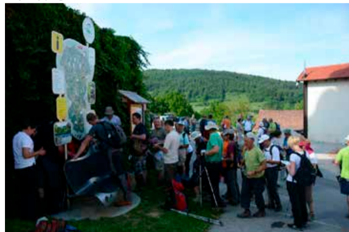
Obleganje info točke na Krki