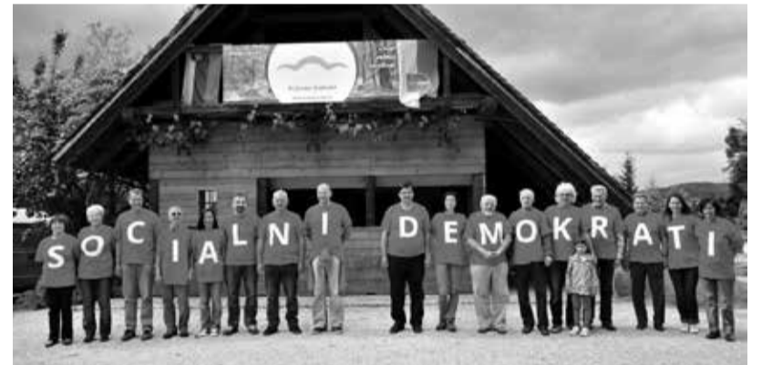
Nekaj utrkov z druženja na Gradišču s kandidatko za poslanko Evropskega parlamenta mag. Tanjo Fajon.