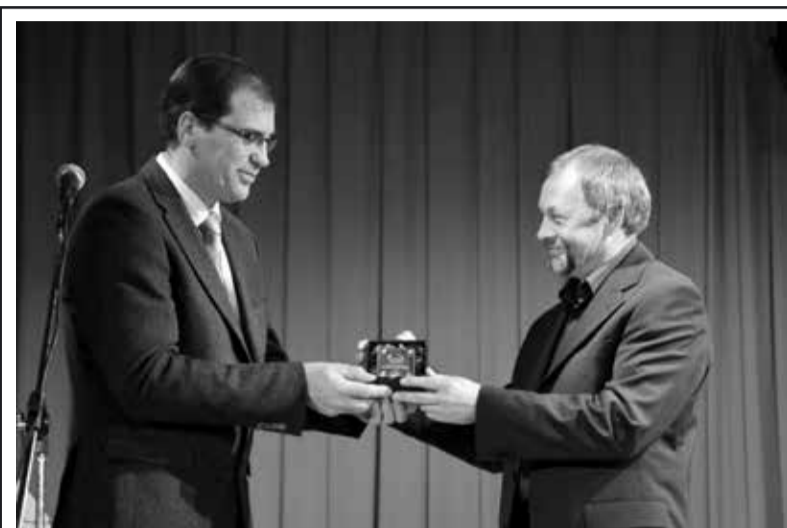
Županovo priznanje Kulturnemu društvu Krka

Popisali smo obsežno časovno obdobje, ki je razdeljeno v tri sklope: pred, med in zgodaj po 2. sv. vojni (od leta 1920 pa vse do šestdesetih let prejšnjega stoletja), obdobje od šestdesetih pa do leta 1994 in obdobje po letu 1994, ko se je formalno registriralo naše društvo, Kulturno