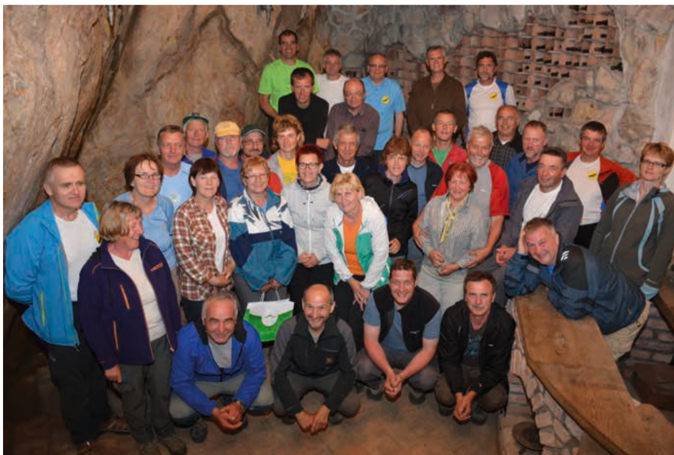
Letos je celotno Krožno pešpot Prijetno domače prehodilo 34 udeležencev