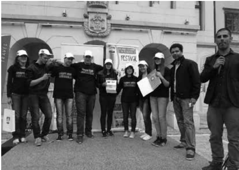
Podelitev priznaj in nagrad