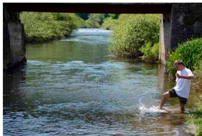
Najbolj pogumni so se osvežili tudi v Krki