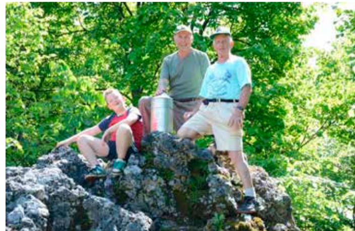
Aljažev stolpič na Kamnem Vrhu