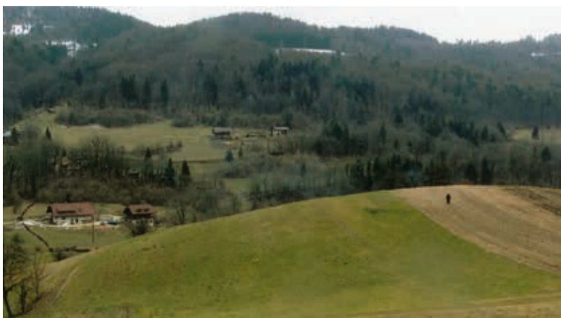
Položnejši lobi so bili primerni za svetišča imenovana tičnice. Na sliki je tičniški lob pri Moravčah. Na njegovem vrhu so kljub agrarnim posegom še vedno vidni sledovi obrednega plataja.

V prejšnji številki sem napovedal nekaj šaljivih prispevkov izpod peresa nekdanjega Slovenčevega satirika s psevdonimoma Frtavčkov Gustel in Korenčkova Neža iz časov hude gospodarske krize. Tedaj so se pojavljali podobni problemi kot v današnjem času. Po pravilu, da imajo dame prednost, bomo začeli z Nežko.