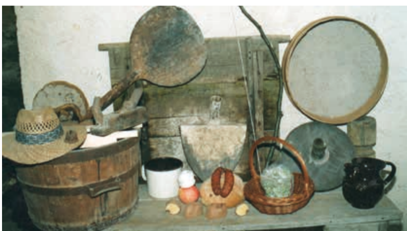
Za vse upodobljene predmete je značilna obla (lokasta, upognjena) oblika, zato jih besedno povezuje enoten besedni skupek lo(k, b,) s številnimi inačicami, nastalimi po premetu.

Pozoren prisluškovalec našemu besedju lahko opazi, da ima določeno število izrazov skupne glasovne sestavine, ki jih družijo v besedne skupine. Glasovna sorodnost ni naključna, temveč je posledica naravnih zvokov, ki so jih naši davni predniki poslušali in vključevali v razvijajoči se jezik. Danes bi si na kratko ogledali besede z glasovnim skupkom (morfemom) »lo«. Včasih se dvočlenskemu morfemu pridruži še »b« oz. »p«, kar kaže, da se je glasovnemu izvoru besede pridružila še oblikovna prvina, v naših primerih »oblo«. Namesto »o« se v nekaterih narečjih pojavljajo tudi drugi vokali (i, ə, ü, ä, ë...). Pozorno si oglejmo pričujočo fotografijo in štejmo: klobuk, klobasa, lok, loputa, lonec, lopar, lopata, kolo, hlebec, loputa, oblič, oblica, kolut, lončenina, locaj, plot, kolovrat, lob, lubje, jabolko, lobanja (ni na podobi), obroč (prvotno obloč). Tu opazimo, da je v nekaterih primerih prišlo do glasovnega premeta, kar je pogost jezikovni pojav. Sedaj nastane vprašanje, kateri predmet je bil najbolj »zgovoren« pri sporočanju svo-