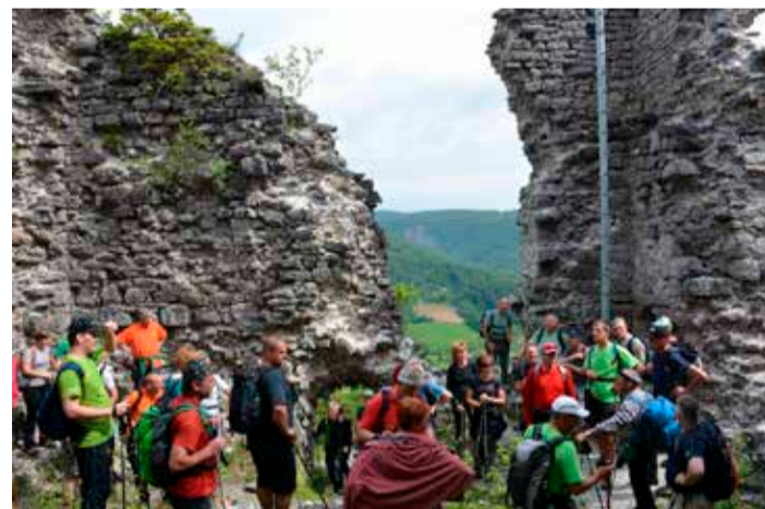
Med razvalinami starodavnega višnjanskega gradu