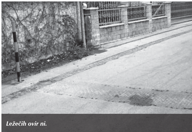
Ležečih ovir ni.

S cest so odstranili ležeče ovire, saj bi bile v napoto pri pluzenju snega, s tem pa so omogočili dirkačem, da vozijo po notranji Jemčevi cesti tudi preko 80 kilometrov na uro. Cesta je brez pločnikov in prehodov, po njej hodijo šolarji, ki so tako še bolj izpostavljeni na milost in nemilost voznikom. Najbrž bo tako do prve hude nesreče.