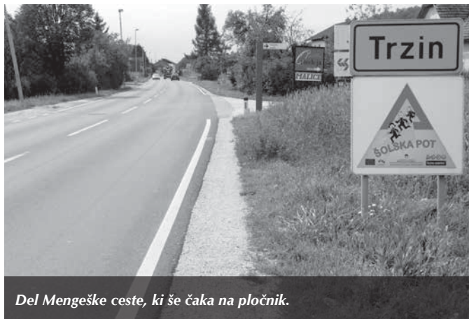
Del Mengeške ceste, ki še čaka na pločnik.