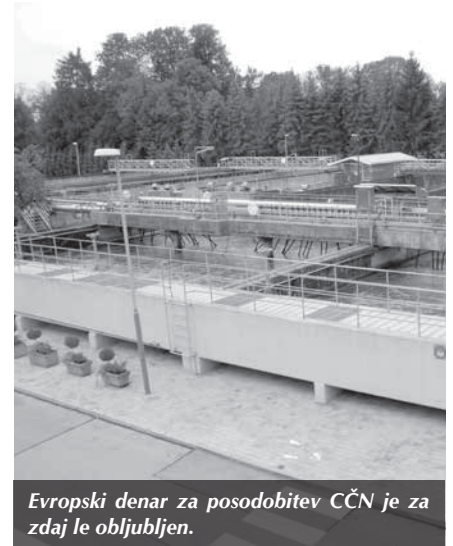
Evropski denar za posodobitev CČN je za zdaj le obljubljen.

Pričakujem predvsem dobro delo. Vsekakor bo potrebno zategovanje pasu, prav