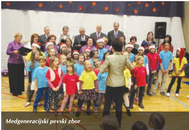
Medgeneracijski pevski zbor

9. decembra 2014 je bil na trzinski osnovni šoli tradicionalni novoletni koncert. Namen koncerta je bil zbiranje sredstev za učence iz manj premožnih družin. Vsak obiskovalec je lahko daroval po svojih zmožnostih; nabrali se je kar nekaj sredstev.