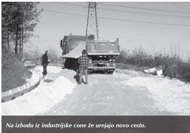
Na izhodu iz industrijske cone že urejajo novo cesto.