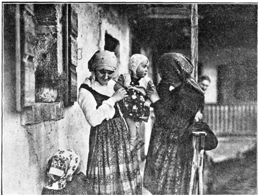
Prizorček iz naše vasi.