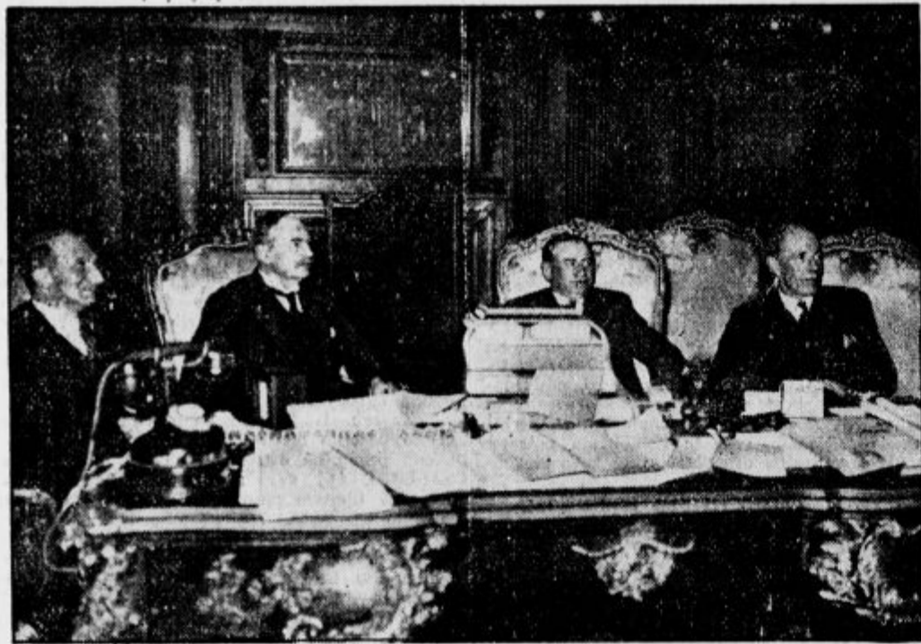
Politična čajanka na Quai d'Orsayu.

V Kaliforniji si je neki navdušeni kolesar zgradil takšnole prikolico in boče spomladi take kole potovati v Florido. V prikolico si je dal posteljo, in voz, ki tehta 100 funtov, bo s svojo siloč vlek el za seboj. Kakor Diogen iz svojega sode, tako gleda njegov moderni naslednik iz prikolice.