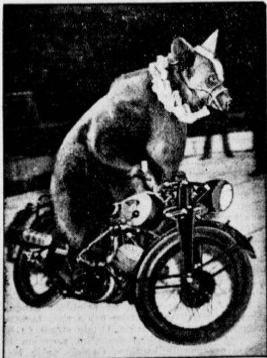
Kosmatinec na motorju.

Iz Charleroija poročajo: V noči od sobote na nedeljo so v globini 704 metrov nenadoma presenetili plini rudarje v rudniku Monceau-Fontaine. K sreči plini niso začeli goreti. Več rudarjev je koj sporočilo to vest navzgor, tako da so mogli še nastopiti reševalni poskusi. Krog četrte ure zjutraj je bila že odstranjena vsa škoda nevarnost. Vendar niso mogli nič več rešiti nekega 43 letnega družinskega očeta, ki je bil od zastrupljenja že mrtev, a 10 rudarjev je zaradi plinskih strupov zbolelo.