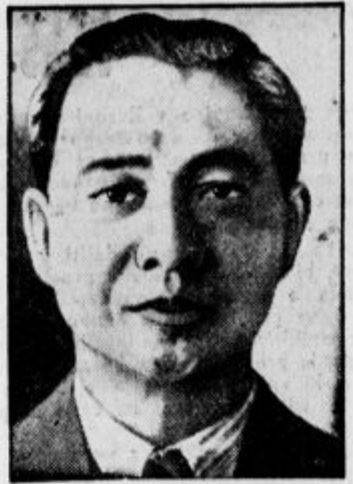
Kitajski general se sporazumeva z Japonsko.

Mussolini in Ciano sta ob prihodu Angležev bila prav tako prisrčno vesela, kakršni so bili izrazi vse množice. Mussolini, ki se je pojavil v črni uniformi častnega korporala fašistične milice, in zunanji minister, ki je bil v sivo-zeleni bojni uniformi, sta pričakovala goste na peronu. Ko je pripeljal vlak na kolodvor in je Chamberlain smehljal se izstopil, je pristopil velikim korakom italijanski šef vlade in je angleškemu ministrskemu predsedniku krepko stisnil roko. Ciano je sledil zgledu svojega tasta, ko je pozdravil lorda Halifaxa. Potem so vsi štirje državniki šli pred kolodvor in so se zbrani množici zahvaljevali za ovacije. Pestra krava barv zeleno-belo-rdečih italijanskih in modro-belo-rdečih angleških zastav kakor tudi razkošni svetilni okrasji, je ta sicer tako mrki in hladni januarski dan povzdignil v pravi pravcati praznik.