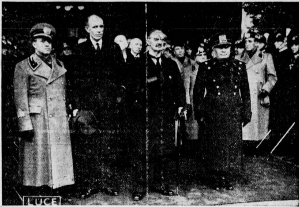
Ob sprejemu angleških politikov v Rimu

Od leve: Italijanski zunanji minister g. Ciano; angleški zunanji minister lord Halifax, angleški ministrski predsednik Chamberlain, poglavar italijanske vlade duce Mussolini