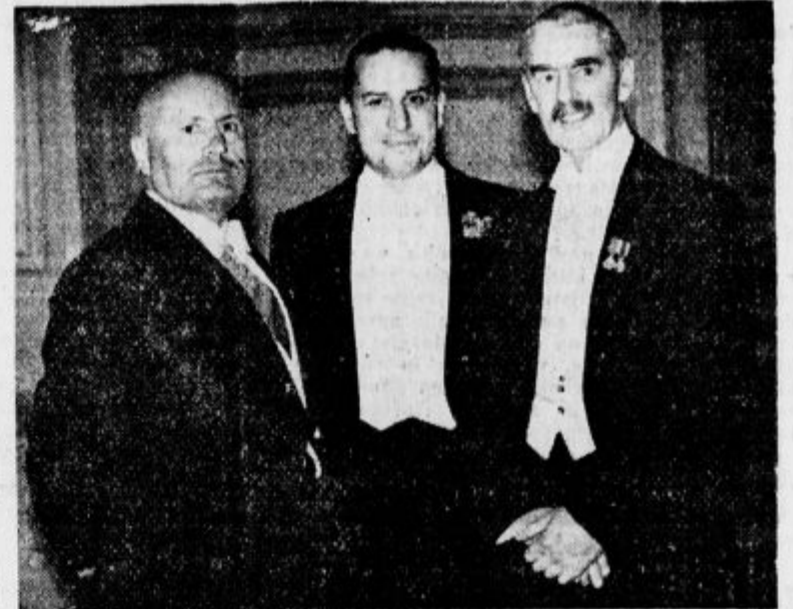
vrno zopet v Pariz. Halifax mu bo poročal o rimskih razgovorih.

Rimski uradni krogi poudarjajo, da je sestanek italijanskih in angleških državnikov potrdil, da niso samo odstranjene vse ovire, ki so pred kratkim ovirale britansko-italijansko sodelovanje, temveč da je prišel do izraza tudi sporazum iz l. 1936-37 in da se lahko zanesljivo pričakuje pravilen razvoj mednarodne politike, ki bo v skladu s mirno ureditvijo Evrope. Italijansko-britanska posvetovanja so se razvijala v zelo prijateljskih okoliščinah in ni ostalo nerešeno niti eno vprašanje, ki se tiče pravih vzajemnih odnosov med obema državama. Po mnenju rimskih krogov je sestanek med angleškimi in italijanskimi državniki izpolnil vsa pričakovanja.