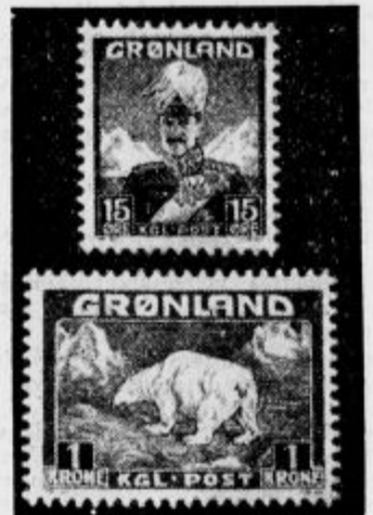
Prve znamke Grönlandije.

V Stambulu je pravkar prvokrat izšel prevod »Nebeške komedije« v turščini. Napisana je v prozi in pojasnjena z raznimi pripombami. Ze v 19. stoletju pa je Danteja prevajal Turak Ragluk Rifki Bey, vendar v francoskem jeziku in je ta prevod segal le do 18. speva »Nebeške komedije«.