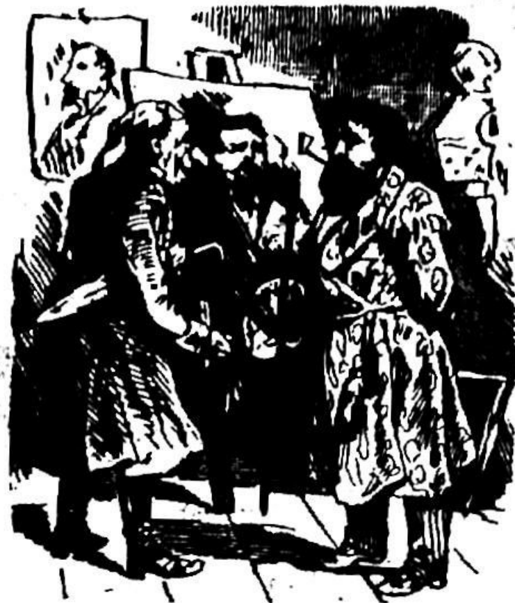
SLIKAR. »Kaj vi hočete, da vas celega naslikam z nogami vred na tako majhen kos platna.« KMET. »Nič ne dé, gospod malar, naj pa noge doli visijo.«