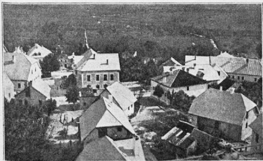
Bovec na Primorskem.

»Po čem?« je povprašal žitnega prodajalca, položivši kako zrnice na zobe, pokušajoč, ali je dovolj močnato.