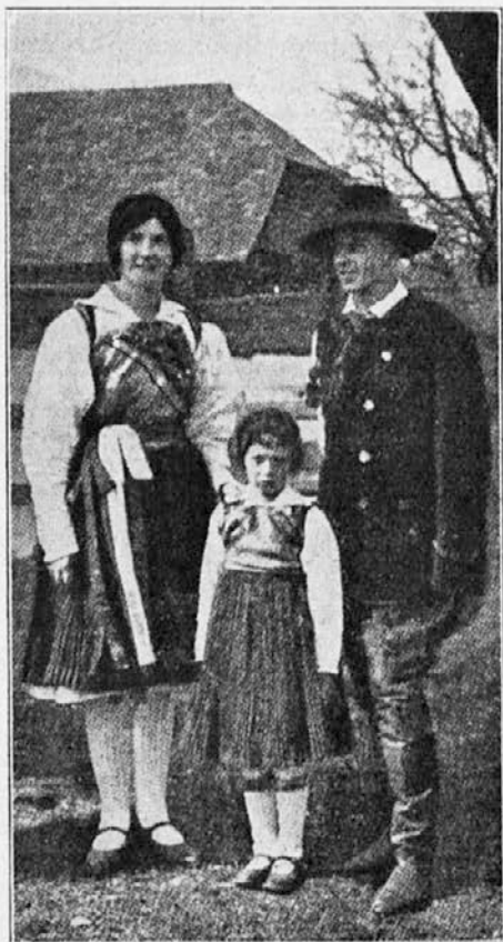
Ziljska narodna noša.

stare navade, kakor jih ne najdeš nikjer drugje med Slovenci. Tudi govorica ziljskih Slovencev ima nekaj prav starih (staro-slovenskih) oblik in besed. Ena taka stara ziljanska posebnost je n. pr. tudi to, da so ljudje na veliko noč (od velike sobote na