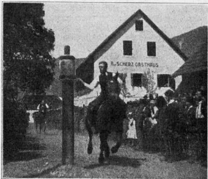
Razbijanje čebra v Ziljski dolini.

Ziljska narodna noša je slikovita in košata. Poda se samo krepkim, čvrstim, visokorastlim dekletom. In takšne so povečini ziljske dekleta.