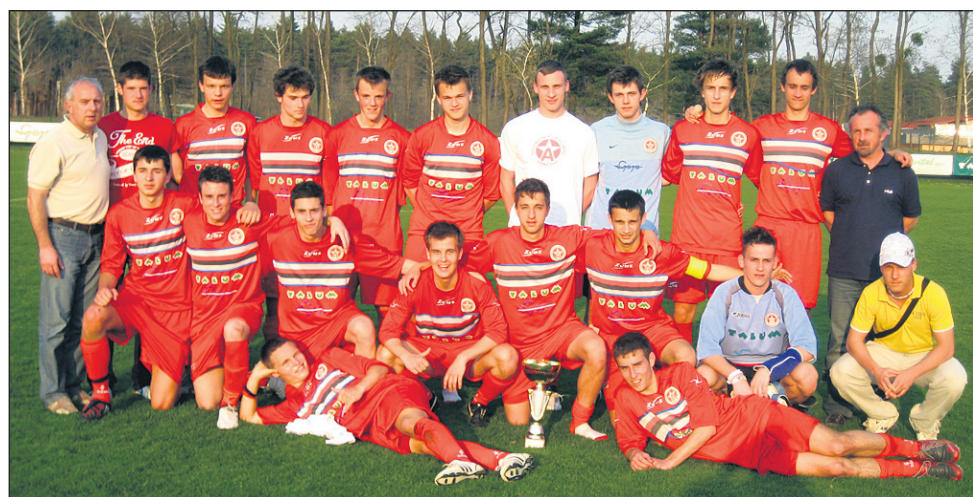
NK Aluminij - zmagovalna ekipa mladinskega pokala MNZ Ptuj