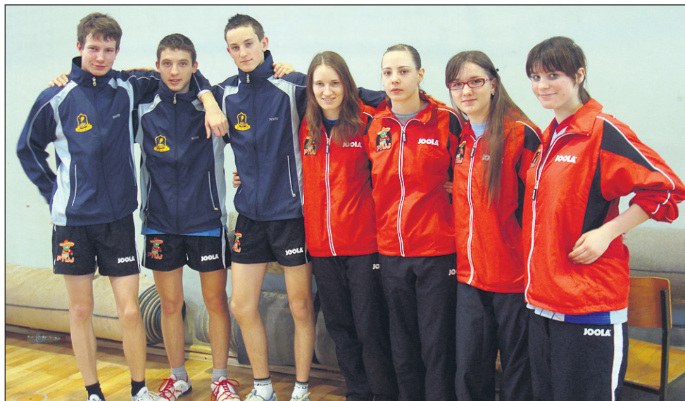
Skupinska fotografija mladincev in mladink NTK Ptuj

Tekmovanje v namiznem tenisu še ni konec, saj je ta konec tedna v Murski Soboti potekalo ekipno državno prvenstvo za mladince in mladinke. Nanj sta se skozi kvalifikacije uvrstili tako ekipa mladincev kot mladink NTK Ptuj. Uspešnejši