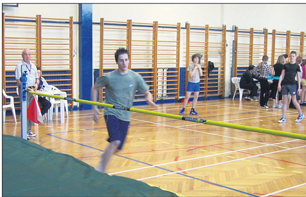
Zimskega atletskega pokala se je udeležilo 120 osnovnošolcev.