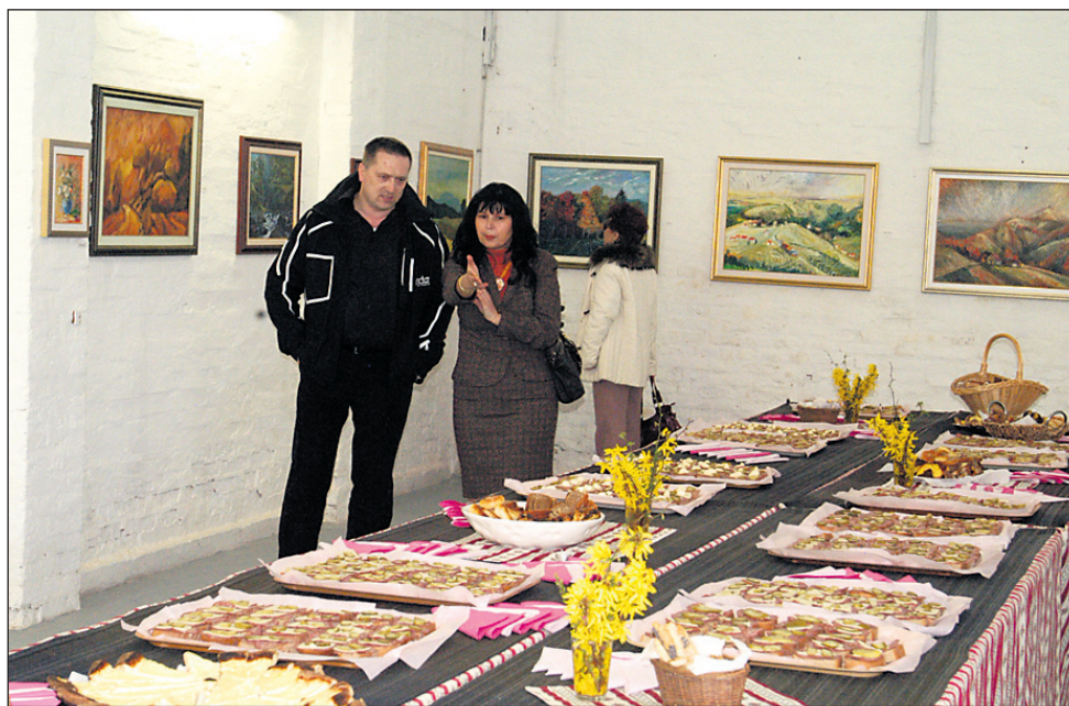
Tik ob muzeju so odprli razstavno galerijo, v kateri so svoja dela prvi predstavili domači likovni ustvarjalci.