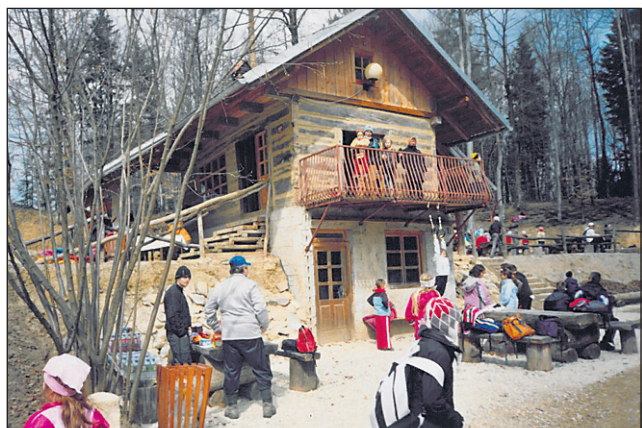
ŠRC Šumica je izhodišče in zaključek Mustrove pohodniške poti; okrog 300 najmlajših pohodnikov pa so zadnjo marčevsko soboto vsaj toliko kot sam pohod navdušile številne igre v naravi, ki so si jih privoščili ob etnografskem muzeju v športnem centru.