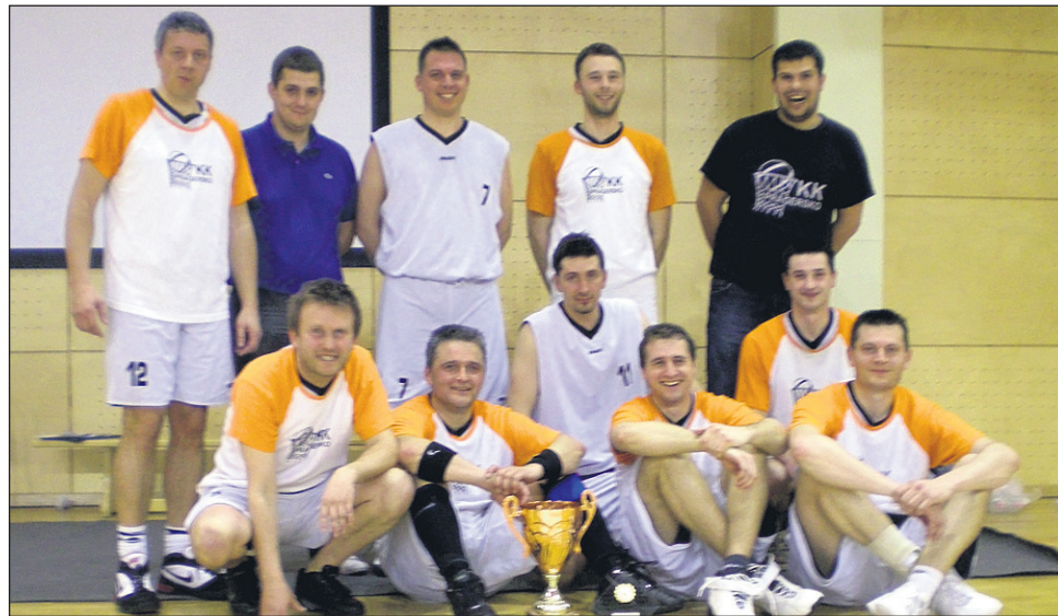
Prvaki PARKL: ekipa KK Pragersko