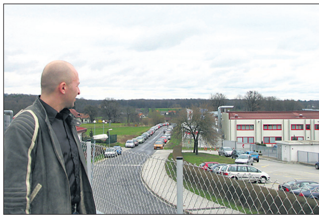
Če bi vedel, kako se bo zanj zadeva razpletla, gotovo ne bi pustil svojih najlepših let in prostega časa za temi zidovi ...