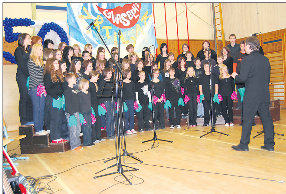
Otroški pevski zbor OŠ Cirkulane-Zavrč je bil med najštevilčnejšimi.