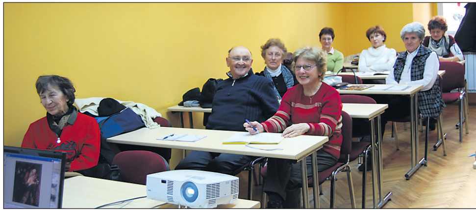
Ljudska univerza Ptuj izvaja kopico programov in delavnic, namenjenih starejši populaciji. Projekt Stari starši in vnuki so začeli izvajati konec lanskega leta.

Kidričevo • Spomin na žrtve taborišča Šterntal