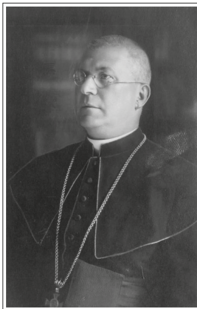
Mihael Opeka (dLib).

Rodil se je 26. septembra 1871 na Vrhniku. Gimnazijo je obiskoval v Ljubljani, kjer je tudi stopil v bogoslovje. Dokončal ga je v Rimu, kjer je leta 1898 doktoriral iz filozofije