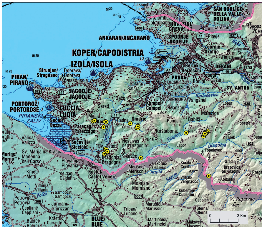
Slika 2: Nahajališča čemaža ( Allium ursinum ) v gričevnem delu Slovenske Istre, avtor nahajališč Zvone Sadar, karto izdelal Iztok Sajko

Figure 2: Localities of Allium ursinum in colline belt of Slovenian Istria, according to data by Zvone Sadar, map made by Iztok Sajko