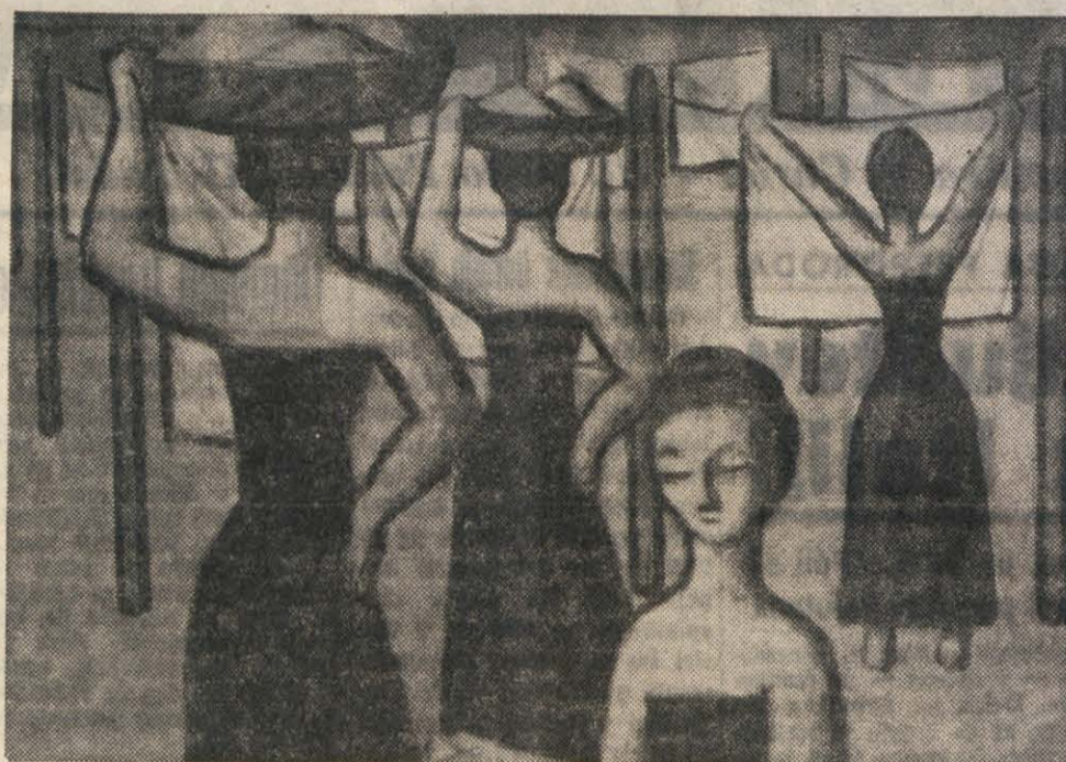
SAKSIDA IMENOVANI SLIKAR RAZSTAVLJA TE DNI V GALERJI 'SCORPIONE'. PRIPOROČAMO, DA SI RAZSTAVO OGLEDAJO VSI LJUBITELJI UMETNOSTI