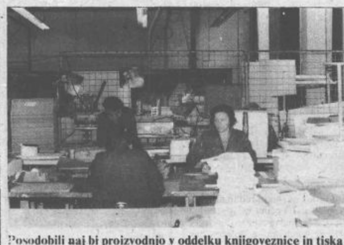
Posodobili naj bi proizvodnjo v oddelku knjigovozne in tiska

V prvih treh mesecih letošnjega leta so višje cene repromaterialov in surovin že naredile svoje. Precejšen izpad dohodka beležijo delavci Rekovne delovne organizacije Tiskarna v mesecih januar in februar, ko jim je primanjkovalo tudi nekaterih vrst papirja. Precej manj pa je bilo še naročil. Izpad dohodka pa so nadomestili z rekordno proizvodnjo v mesecu marcu.