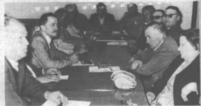
Delegati na seji redne letne skupščine zveze društev upokojencev občine Velenje