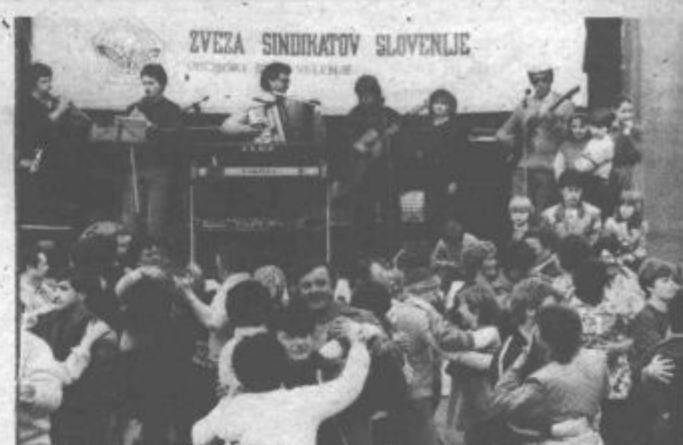
Mnogi so trimčkali tudi na plesišču