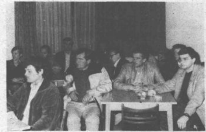
Na letni konferenci so udeleženci kritično spregovorili o delu v preteklem letu