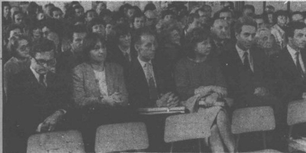
Na slovesnosti so se zbrali številni gostje