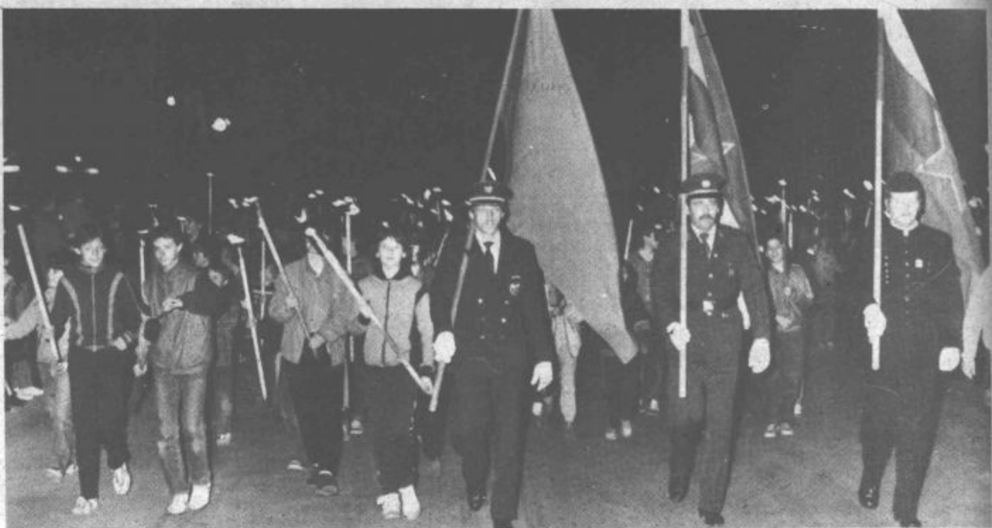
Spomin na krvave dogodke v Chichagu pred 99. leti, ko so se delavci borili za svoje pravice, smo v Titovem Velenju počastili s slavnostnim sprevodom z balkami, v katerem so tudi letos

Kljub dežju, snegu pa je bilo v Šaleški dolini ob dnevu osvobodilne fronte in mednarodnem delavskem prazniku vendarle nadvse praznično. Na okoliških vrhovih so marsikje zagoreli kresovi, ob njih so se zbrali stari in mladi, marsikje so postavili visoke mlaje. Res pa je tudi, da so nekateri pozabili izobesiti zastave — simbole naše državnosti, pripadnosti in zvestobe naši skupnosti.