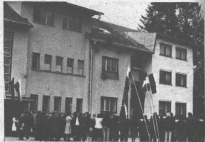
Zdravstveni dom je za Nazarje in dolino velika pridobitev

Tokrat so bili boljši mladi igralci, ki so zmagali z rezultatom 114:96 in tako skupno vodstvo starejših zmanjšali na 4:3. Prihodnje leto bo tako merjenje moči znova pridobilo na zanimivosti. Maraton so zgledno pripravili marljivi člani športnega društva Vrbovec, velja pa dejstvo, da je znova v precejšnji meri razgibal mrtvilo prazničnih dni v kraju.