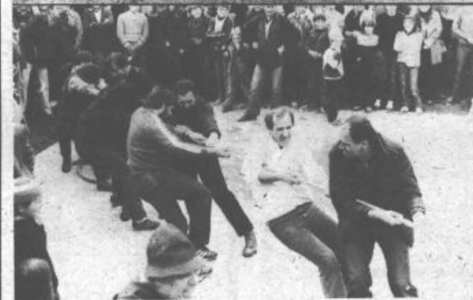
Po tem pohodu pa so nekateri pokazali svojo moč ob vlečenju vrvi. Za dve svinjski glavi in zaboja piva ter kokte je tekmovalo 8 moških ter 4 ženske ekipe. Pri moških je največjo žilavost pokazala ekipa KS Plešivec, med ženskami pa ekipa, ki se je predstavila pod imenom Razvajenke.