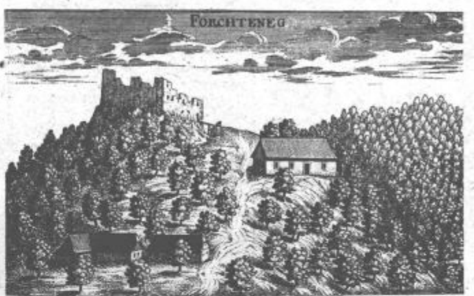
Bakrorez, ki je nastal štiri desetletja po upor, nam Forchteneck že kaže v razvalinah

je prav gotovo moralo zapustiti vidne sledove v ljudskem izročilu. (Dalje prihodnjič)