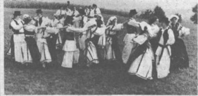
Plesalci se držijo za ramena in pojejo pesem »Faljila se Faljisava«.