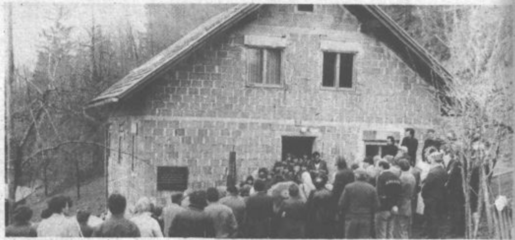
Pred rojstno hišo padle partizanske kurirke Angele Avberšek se je ob krajevnem prazniku in ob odkritju spominske plošče zbralo precej krajanov in gostov.