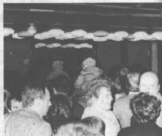
Takšna nepotrebna gneča pa je bila po končanem sprevodu z balkami pred Rdečo dvorano. V dvorani je bil zatem prvomajski ples. Čeprav je bil vstop prost, so bila odprta le ena vrata.