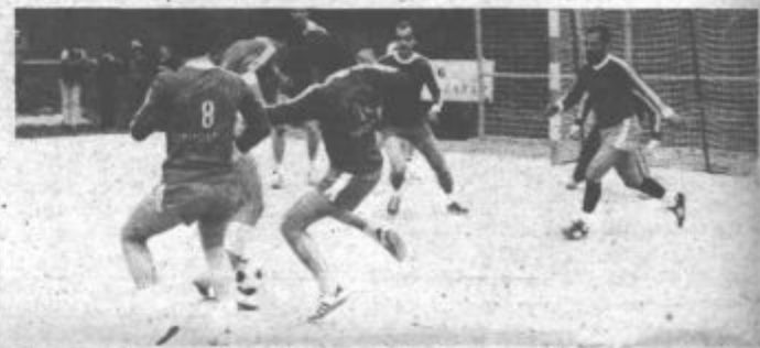
Na nazarskem maratonu borbenosti in športnih užitkov ni manjkalo