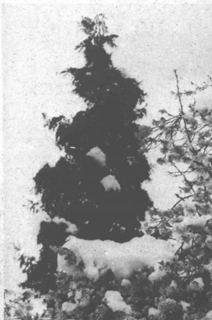
Cvetovi v snegu