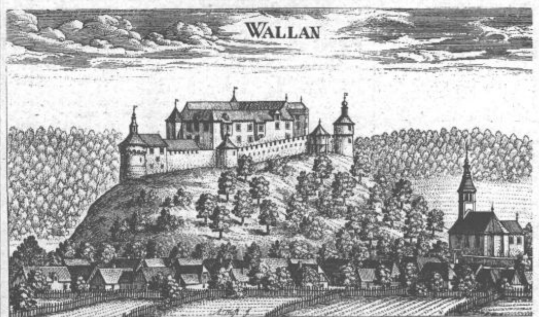
Velenjski grad je bil s svojim obrambnim zidovjem pretrd oreh za uporne kmete