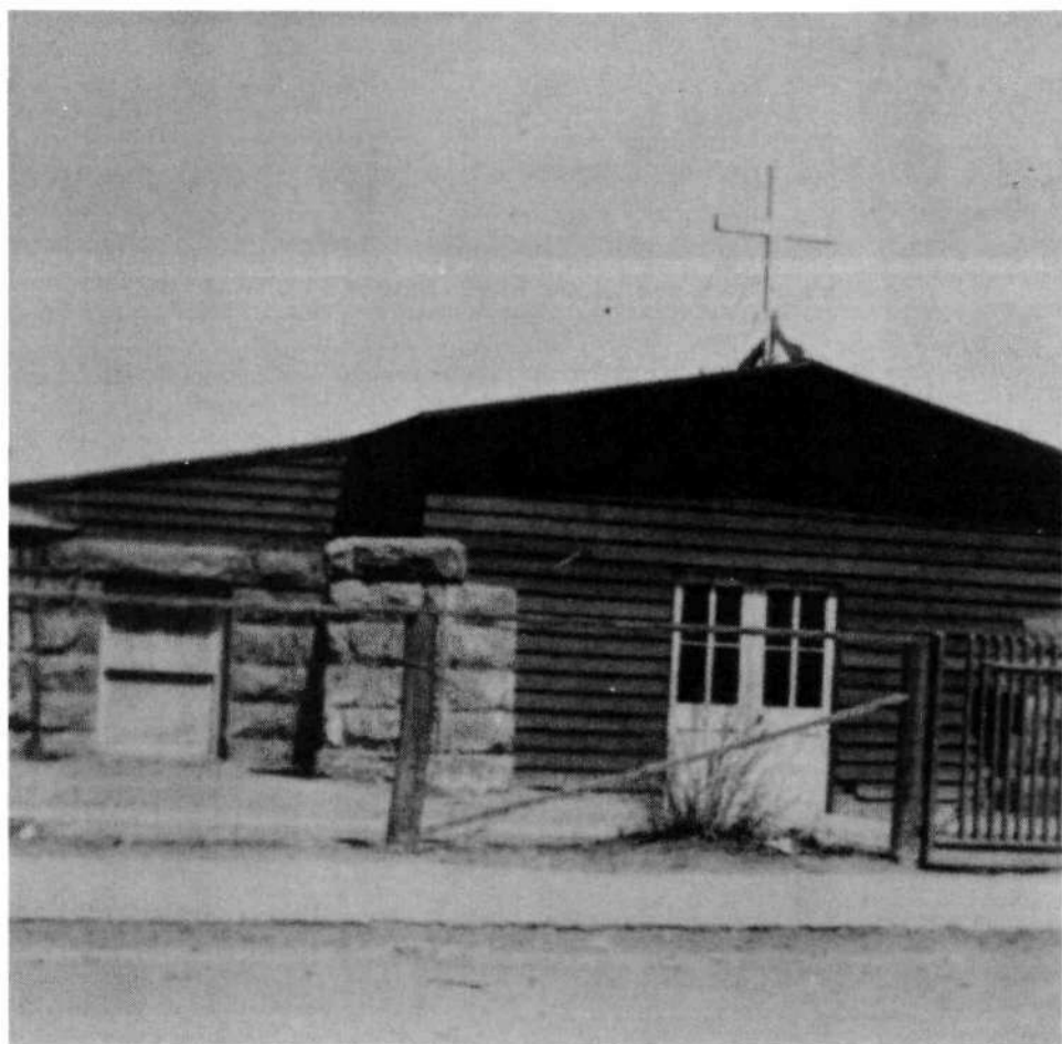
Osnova cerkve sv. Cirila in Metoda – pred gradnjo današnje