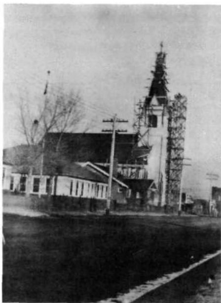
Sedanja cerkev sv. Cirila in Metoda med gradnjo