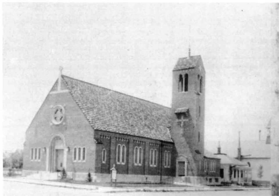
Druga katoliška cerkev v Rocks Springsu – cerkev Žalostne matere božje