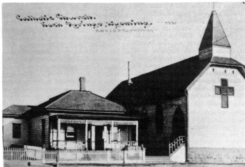
Gradnja župnišča in prve začasne, lesene cerkve sv. Cirila in Metoda

duhovnik v cerkvi sv. Cirila in Metoda posvečen Baldwin Haydock. Umrl je v mestu Pueblo v državi Kolorado leta 1968.