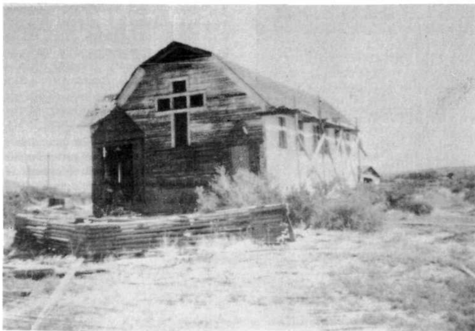
Prva katoliška cerkev v mestu v začetku tega stoletja (danes je ni več)

Schiffrer posvetil organizaciji svoje župnije, pobirati pa je začel tudi prispevke za gradnjo nove cerkve, katere lokacija je bila zagotovljena po posredovanju škofa »Union Pacific Coal Co.«, (Zveza pacifiških premogovnikov).