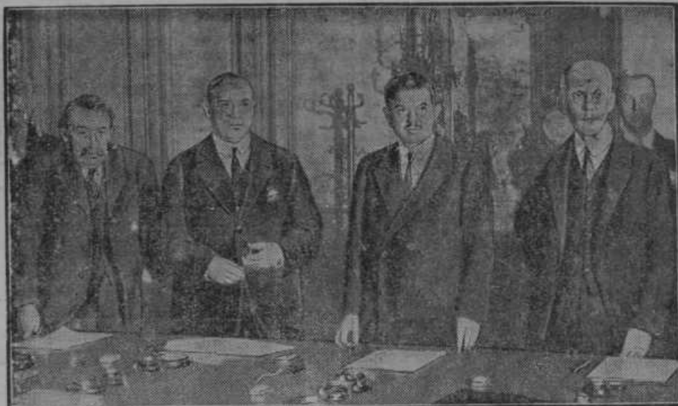
Boj za Hooverjev predlog. Amerikanski finančni minister Mellon se posvetuje s francoskimi politiki. Na sliki vidimo od leve na desno: Briand, francoski zunanji minister — amerikanski poslanik v Parizu Edge — francoski ministrski predsednik Laval in finančni minister Združenih držav Mellon.

Izsledena tatvina blaga. Trgovcu g. Škofu v Št. Lenartu pri Slovenjgradcu