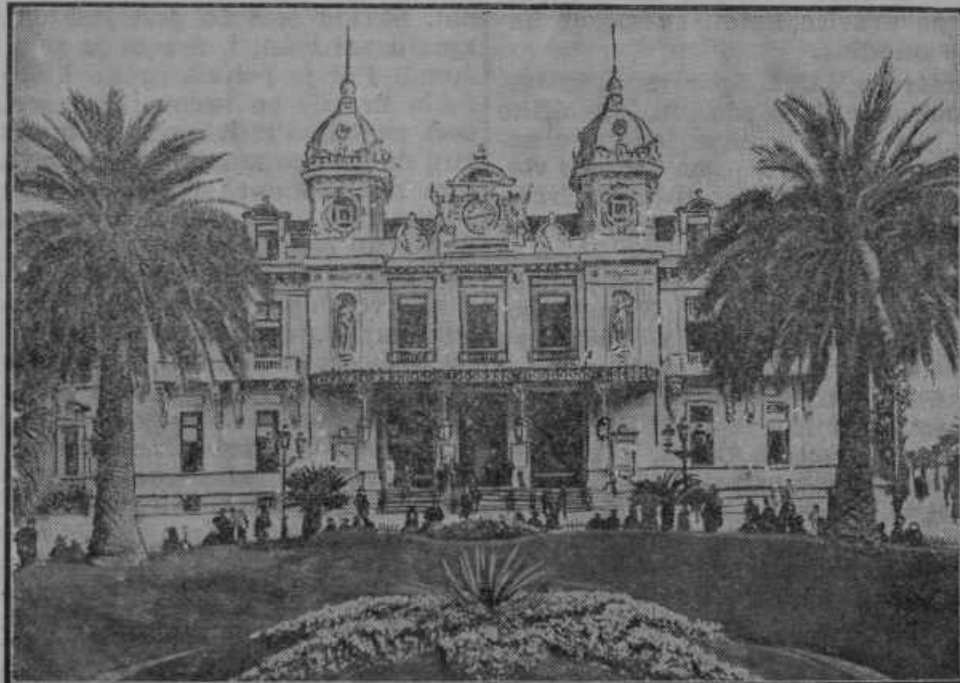
Igralna palača v Monte Carlo v republiki Monako ob južno-francoskem morskem obrežju. Igralnica, ki je rodila že toliko zla, obhaja 70letnico in plačuje državi letno od čistega dobička 4 milijone frankov.

je odnesel krojač Artur Galuf blaga za 25.000 Din. Ukradeno blago so našli orožniki shranjenega pri nekem posestniku in ga pripeljali nazaj na vozu pravemu lastniku.