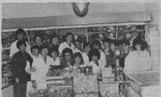
Kolektiv marketa v Savskem naselju.