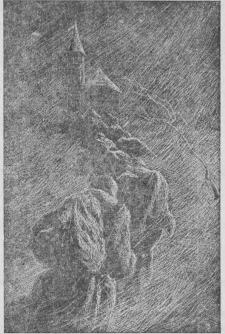
B. Jakac (jedkanica) — S pohoda XIV. divizije

Ko je pripovedovala je gledala predse, takrat, ko je začela govoriti o bom-