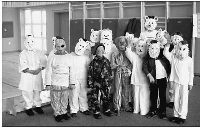
Severni medvedi iz OŠ Cirkovce

Za pusta smo se sošolci našemili v severne medvede. Maske smo izdelali sami. Dobili smo nagrado. Druge maske so