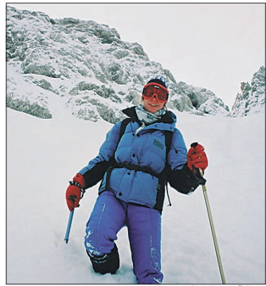
Fotografije: Primož Trop