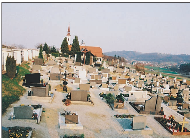
Pokopališče v Zavrču je polno, saj je na njem prostora le še za nekaj grobniških mest, zato potrebujejo novega.

Po drugi obravnavi so završki svetniki z nekaj manjšimi lepotnimi pripombami dokončno sprejeli občinski proračun, v katerem naj bi letos zbrali