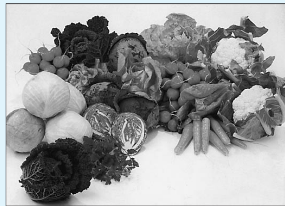
Vrtnarjenje do kakovostnih vrtnin

Škodljivce, ki so na sadnem drevju prezimili - med njimi so najštevilnejši kaparji, cvetožerji, zimska jajčeca listnih uši in rdeče sadne pršice - zatremo z belim oljem ali podobnimi organskimi pripravki v predpisani koncentraciji proizvajalca. Ti pripravki niso strupeni, ob pravilni in pravočasni uporabi pa škodljivce uničijo tako, da jih za-