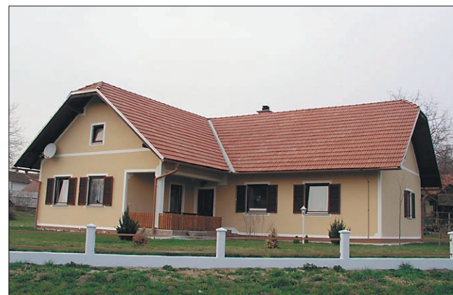
Primer dobre prakse je novogradnja v Obrežu. Lastniki so upoštevali nasvete strokovnjaka in v okolje umestili hišo, ki sem sodi