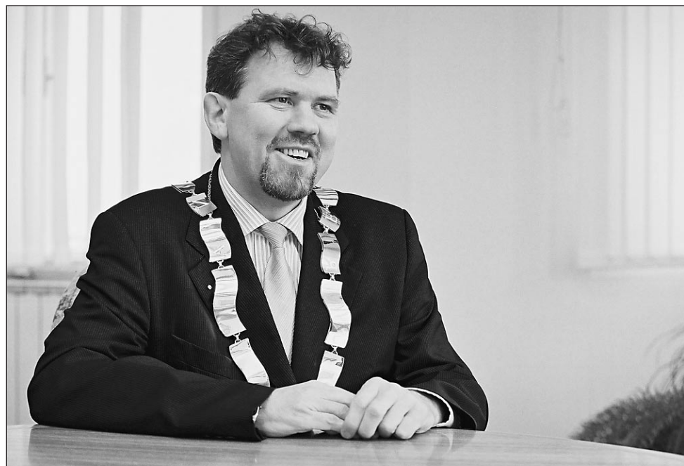
"Prednost naj imajo vlaganja v ljudi ..."