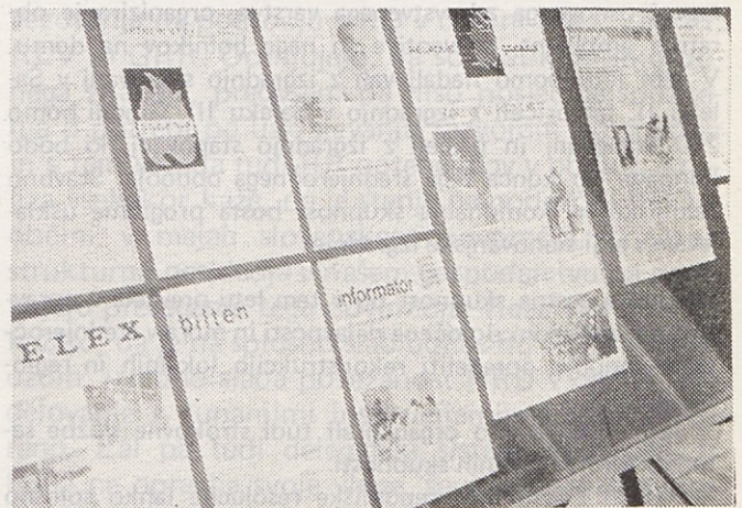
Z razstave o delavskem tisku

Mesečne tovarniške liste izdajajo tudi v vseh drugih organizacijah združenega dela velenjske občine. Razstava v velenjski knjižnici bo odprta do 30. marca, organizirali pa bodo še ogleda za šole in druge organizirane skupine.