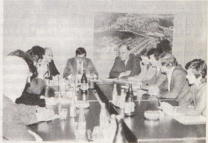
Na sliki: uredniki Dela med pogovorom v Gorenju SOZD