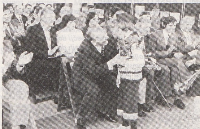
Goste so prisrčno pozdravili pionirji OŠ Antona Aškercarja.